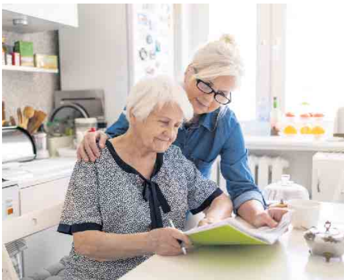
Das Thema Pflege muss kein Buch mit sieben Siegeln bleiben. Dafür sorgen diverse Beratungsangebote.

Pflegebedürftigkeit: So lässt sich der Alltag organisieren