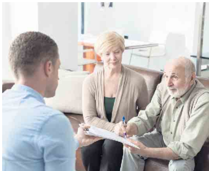
Wenn der Pflegefall eintritt, muss vieles schnell organisiert werden.

Ein plötzlicher Pflegefall in der Familie trifft die Angehörigen meist überraschend, häufig macht sich zunächst einmal Ratlosigkeit breit. An was muss zuerst gedacht werden? Wer sollte informiert werden? Wo gibt es die notwendigen Formulare? Und auf welche rechtlichen Feinheiten ist zu achten? Danach muss der Pflegealltag organisiert und finanziert werden: Kann der Pflegebedürftige in seiner gewohnten Umgebung bleiben und häuslich betreut werden oder ist ein geeignetes Pflegeheim nötig?