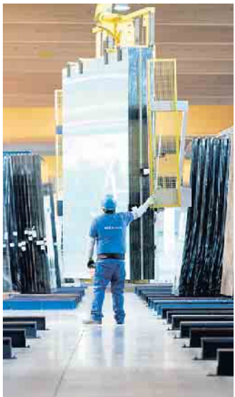
In der Flachglasbranche gibt es spannende Ausbildungsmöglichkeiten.