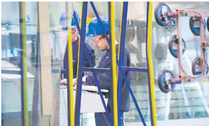
In der Flachglasbranche gibt es spannende Ausbildungsmöglichkeiten.