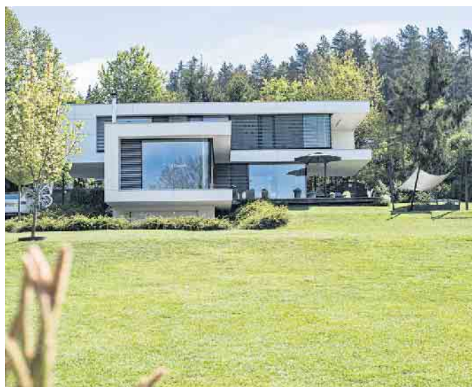
Flaches Dach, kubische Baukörper - das kommt bei vielen Bauherren gut an.