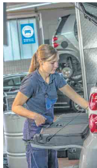
Berufe in der Kfz-Branche leisten einen wichtigen Beitrag zur Mobilität der Gesellschaft.

Dazu werden die Perspektiven aufgezeigt, die sich für die Berufseinsteiger nach dem erfolgreichen Ausbildungsabschluss eröffnen. So bringt bereits eine zweijährige Weiterbildung Spezialisierungen innerhalb des gewählten Ausbildungsberufs hervor, etwa