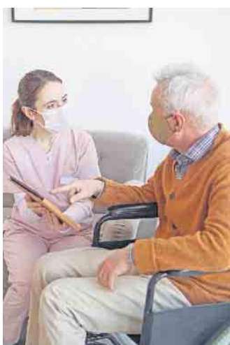
Oftmals kann der Pflegebedürftige in seiner gewohnten Umgebung bleiben und ambulant betreut werden.

Getragen werden die Stellen in der Regel von der jeweiligen Kommune oder von Pflegediensten. (djd)