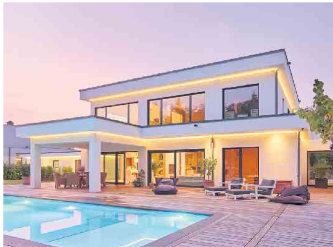
„Die Bauhausarchitektur ist Ausdruck von Individualität und Stilsicherheit.“

Besonders einfach und komfortabel sind Fertighäuser für den Bauherren, wenn er sich für eine schlüsselfertige Bauausführung entscheidet. Laut einer Umfrage unter den BDF-Mitgliedsunternehmen werden fast 90 Prozent schlüsselfertig oder in einem weit fortgeschrittenen Maß bezugsfertig ausgeführt. „Auch das passt in die heutige Zeit, in der viele Familien zeitlich immer stärker eingespannt sind oder das Mehr an Komfort besonders schätzen. Mit einem schlüsselfertigen Holz-Fertighaus kommen sie entspannt und planungssicher in ihrem individuellen Traumhaus an“, schließt Tews. (BDF/FT)