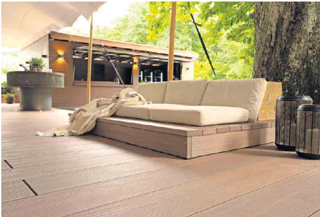
Die Dielen aus dem Verbundmaterial sehen aus wie Holz - sind aber ungleich pflegeleichter und langlebiger.

Sägewerken, Recyclingmaterialien sowie umweltfreundlichen Additiven zusammen. Unter www.megawood.com etwa gibt es mehr Details. Die unabhängige „Cradle to Cradle“-Zertifizierung in Gold bestätigt die Kreislauffähigkeit und die Zertifizierung in Platin die Materialgesundheit aller Inhaltsstoffe. Damit passt das Material sehr gut zu den Plänen der Mühlenbesitzer, denen gesundes, nachhaltiges Bauen besonders wichtig ist. „Die Mühle soll wieder für die Öffentlichkeit zugänglich gemacht werden. Die Menschen sollen hier zusammenfinden, gemeinsam feiern und den Ort zum Entspannen, Erholen und Wohlfühlen nutzen“, erklärt Oliver Bartsch. Das Erreichte kann sich sehen lassen: Die Mühle wurde im Zeichen des nachhaltigen Bauens und unter Denkmalschutzauflagen aufwendig saniert. (djd)