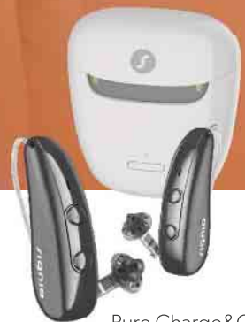
Pure Charge&Go IX

BRILLANTES HÖREN HÖRGERÄTE AUS MEISTERHAND