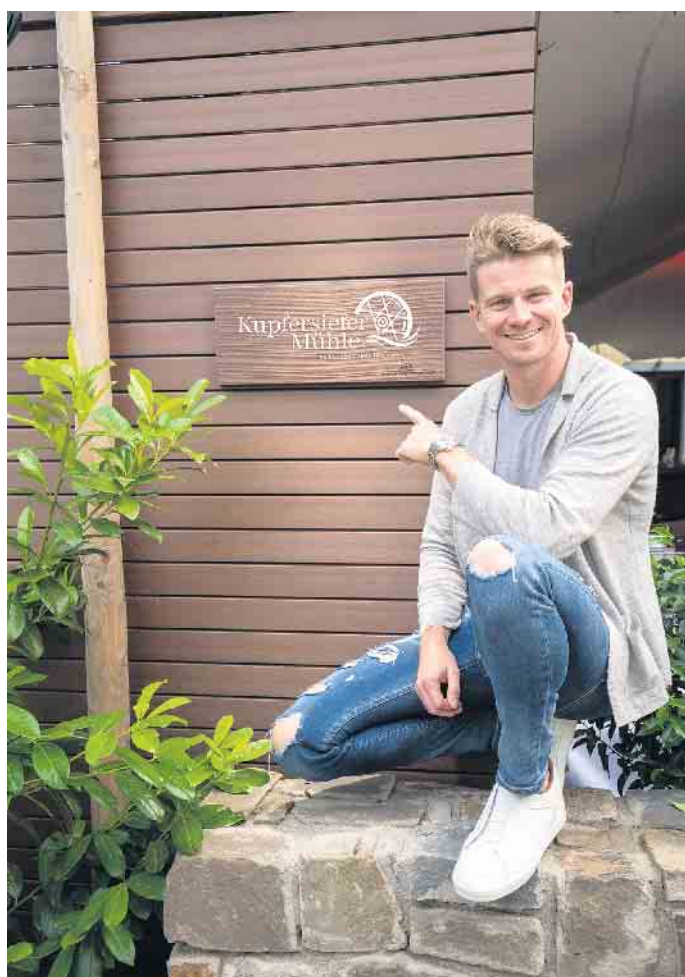
Formel-1-Rennfahrer Nico Hülkenberg hat sich auf den ersten Blick in die historische Mühle verliebt.

Bei GCC handelt es sich um einen Werkstoff made in Germany, der gesundes Bauen über Generationen hinweg ermöglicht. Er setzt sich aus Holzfasern von