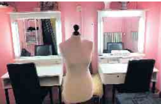
Eine Garderobe im kleinen Theater

Kleines Theater beim Tag des offenen Denkmals