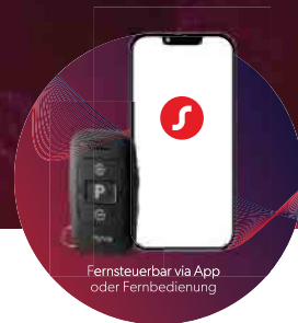
Fernsteuerbar via App oder Fernbedienung

BRILLANTES HÖREN HÖRGERÄTE AUS MEISTERHAND