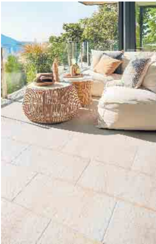
Ausdruckstarke Terrassenflächen im Großformat: avelina® XXL-Platten im Format 80x40x3 cm in beige-meliert

KOLL Steine setzt auf nachhaltige Betonsteinproduktion: Das Werk in Bonn ist CSC-Gold-zertifiziert. Durch den Einsatz von erneuerbaren Energien, Sekundärmaterialien und CO 2 -Kompensation arbeitet das Unternehmen klimabewusst und transparent.