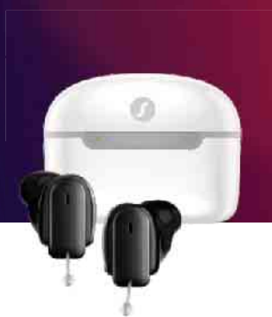
Insio Charge&Go IX

Die kleinsten Im-Ohr-Hörgeräte mit Akku nach Maß.