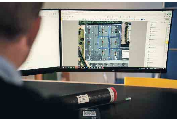
Die Überwachung erfolgt digital, bei kritischen Messwerten wird per Mail informiert.