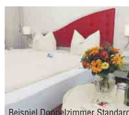
Beispiel Doppelzimmer Standard