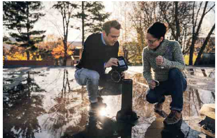
Intelligente Dachlösungen: Von Dachdeckern für Dachdecker entwickelt.

bei, unsere Gebäude effizienter, nachhaltiger und widerstandsfähiger zu machen. Diese Entwicklung zeigt, dass das Dachdeckerhandwerk eine wichtige Rolle in der Bauindustrie spielt und auch einen entscheidenden Beitrag für eine nachhaltige Zukunft leistet. (akz-o)