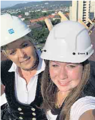
Klimaschutz, keine reine Männersache; es gibt auch Frauen im Dachdeckerhandwerk.