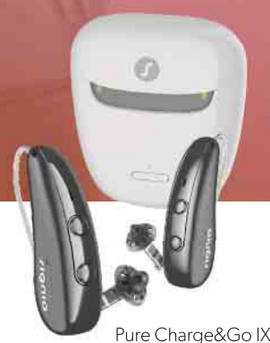
Pure Charge&Go IX