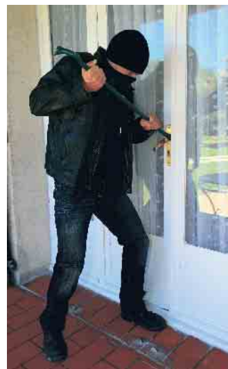
Auch Terrassen- oder Nebeneingangstüren sollten mit einbruchhemmenden Elementen ausgestattet sein.

Dafür müssen die Einbruchopfer schnellstmöglich eine Stehlgutliste an den Versicherer und die Polizei geben. Bei Neubauvorhaben, Renovierung, An- oder Umbau gilt es, den Einsatz einbruchhemmender Außentüren, Terrassen-Balkon-Türen und Fenster einzuplanen. Schließzylinder sollten gegen Abbrechen, Herausreißen und Kernziehen geschützt werden. Auch wichtig: den eigenen Haustürschlüssel nie draußen deponieren und die Haustür immer abschließen. Außenbereiche sollten beleuchtet sein, beispielsweise mit Bewegungsmeldern. Und nicht zuletzt sollte man weder auf dem eigenen Anrufbeantworter noch in den sozialen Netzwerken Hinweise auf die geplante Abwesenheit hinterlassen. (akz-o)