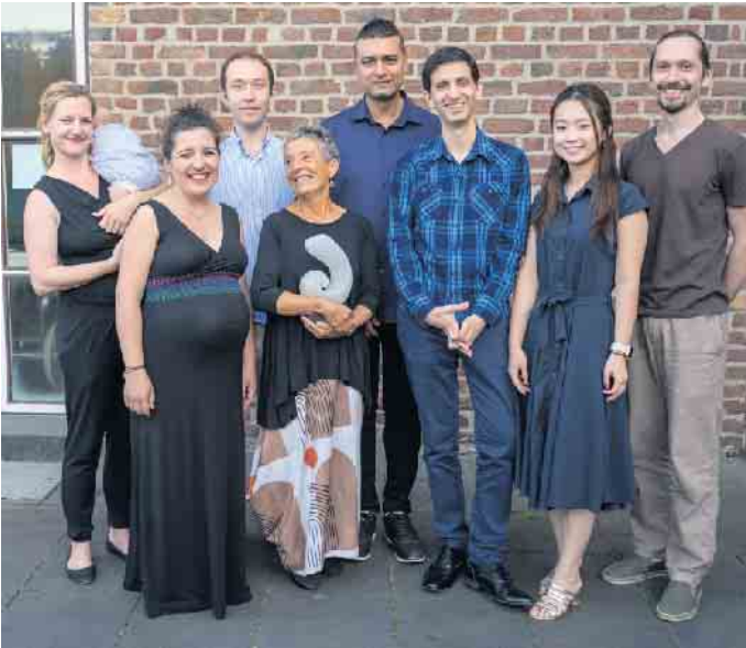
Maria João Pires und die Partitureilnehmer im Kelterhaus Muffendorf

Ein Fest für Maria und das Haus am Stadtwald