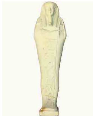
Dieses Bild zeigt beispielhaft ein Uschebti

Für Kinder ab sechs Jahren werden Workshops an folgenden Terminen angeboten: 2. und 3. September sowie 30. September und 1. Oktober jeweils um 13 und 15 Uhr.