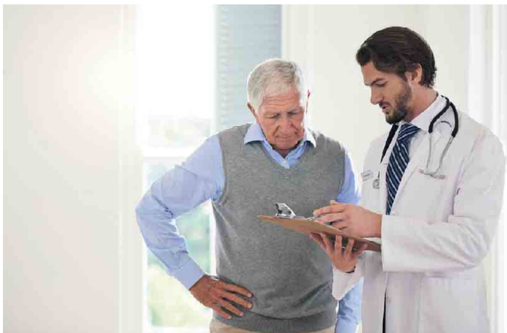
Bei Herzinsuffizienz sollten Ärzte genau hinschauen.

Was verbirgt sich hinter der Herzinsuffizienz? Es gibt viele Möglichkeiten, zum Beispiel koronare Herzkrankheiten oder die Folgen eines nicht behandelten Bluthochdrucks, aber auch unterdiagnostizierte Erkrankungen wie die Transthyretin-Amyloidose mit Kardiomyopathie (ATTR-CM). Letztere zu erkennen, erfordert von den behandelnden Ärzt:innen detektivischen Spürsinn. Die Ermittlungen starten bei der Patientengeschichte: Gab es eine Operation aufgrund eines Karpaltunnelsyndroms, vielleicht sogar an beiden Handgelenken? Ist eine Verengung des Wirbelkanals in der Wirbelsäule bekannt? Das Elektrokardio-