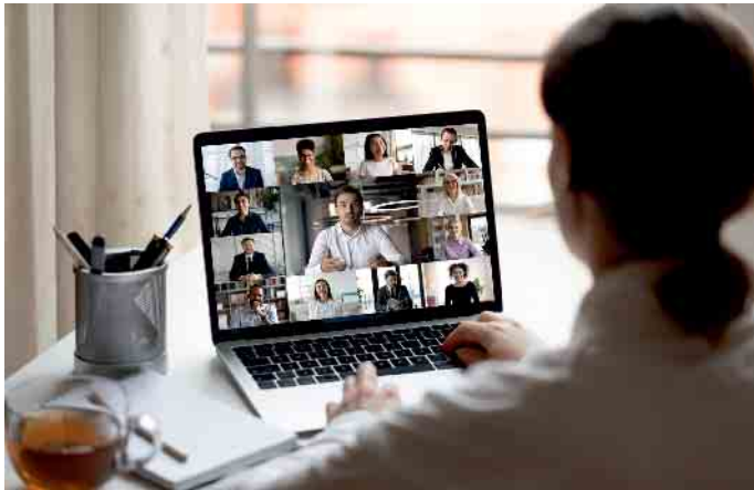
Bonner CI-Treff goes hybrid

Weitere Informationen zum Bonner CI-Treff sowie den Veranstaltungen