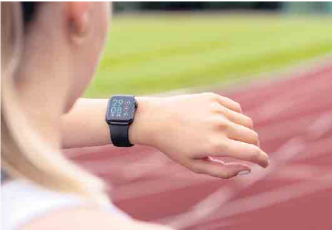
Für die technische Entwicklung von digitalen Daten im Sport-, Fitness- und Gesundheitsbereich werden qualifizierte Spezialistinnen und Spezialisten benötigt.

Media-Marketing über die Entwicklung digitaler Systeme bis hin zur Suchmaschinenoptimierung - für den Studiengang gibt es noch offene Ausbildungsangebote mit verschiedenen Tätigkeitsbereichen. Das duale Bachelor-Studiensystem der Hochschule verbindet eine betriebliche Tätigkeit und ein Fernstudium mit kompakten Lehrveranstaltungen, die digital oder an elf Studienzentren in Deutschland, Österreich und der Schweiz absolviert werden können. (DJD)