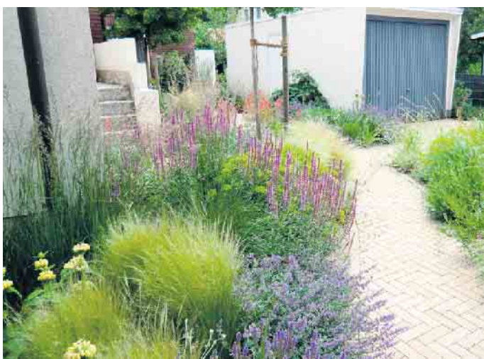
Eine sehr gelungene, artenreiche und harmonische Komposition verschiedenster Stauden.

auch als Schein-Pflegeleichtigkeit bezeichnet werden.