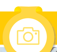
Bild der Woche

Danach die Zucchini mit dem Kräuter-Zitronen-Öl bestreichen, auf einem heißen Grill für ca. 6 Minuten garen und währenddessen immer wieder mit dem Öl bestreichen.