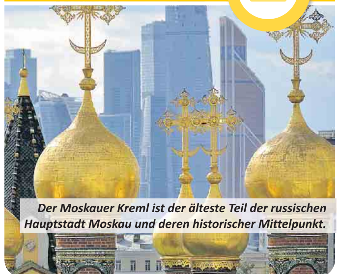
Der Moskauer Kreml ist der älteste Teil der russischen Hauptstadt Moskau und deren historischer Mittelpunkt.