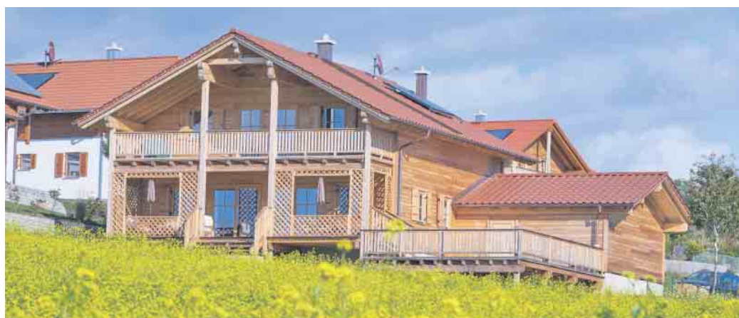
Privathäuser, Hotels und vieles mehr wird heute immer öfter in Holz-Fertigbauweise errichtet.

„Wir befinden uns in einer Frühphase der wirtschaftlichen