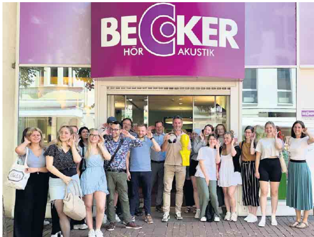
Gruppenfoto im Rahmen des erneuten Besuches der Logopädieschule Bonn bei BECKER Hörakustik am 21. Juni 2024,