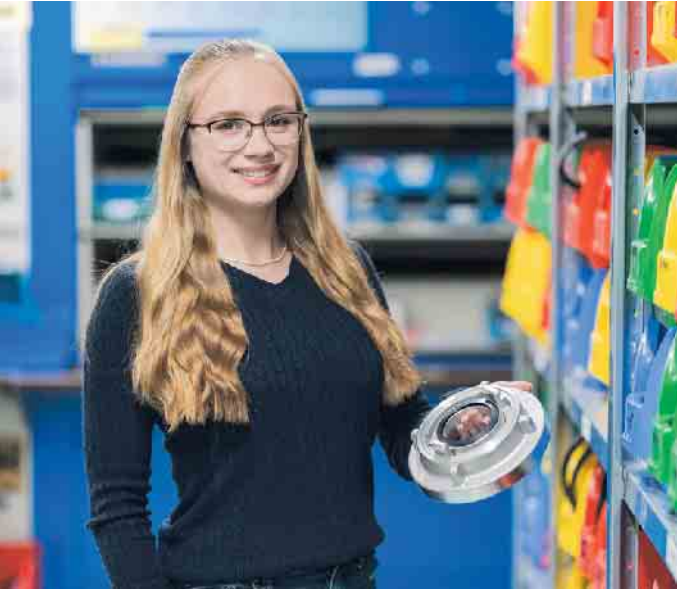
Kaufleute für Groß- und Außenhandelsmanagement sorgen für einen reibungslosen Warenfluss.

Viele Schulabgehende suchen eine Ausbildung nahe ihrem Wohnort. Grund genug für den VTH Verband Technischer Handel e.V., ab sofort eine Suche nach Postleitzahlen anzubieten. Im Internet können Suchende ihren Wunschort eingeben und das Suchkriterium „Ausbildungsbetrieb“ anklicken. Sofort werden ihnen die nächstgelegenen Großhändler angezeigt. Die Adresse dieses Services lautet: www.ich-will-handeln.eu . Der Technische Handel vereint mehr als 400 Betriebsstätten im deutschsprachigen Bereich. Die Technischen Händler versorgen Industrie, Gewerbe und Handwerk mit sämtlichem Bedarf, der für Produktion und Dienstleistungen erforderlich ist. Die Branche hält mehr als 1.000.000 Artikel bereit. Entsprechend vielseitig sind die Tätigkeiten an der Schnittstelle