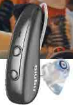
Pure Charge&Go IX