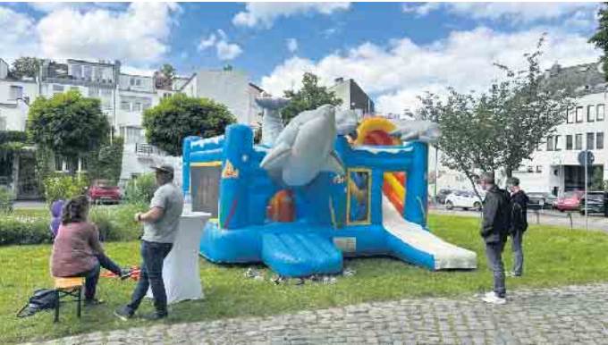
Die Hüpfburg war den ganzen Nachmittag über in Betrieb und wurde von den kleinen Gästen begeistert angenommen.

Am Samstag, 15. Juni, feierte der Bonner CI-Treff sein Sommerfest - kurz und knapp: Es war wieder ein voller Erfolg! Darüber waren sich die rund 200 Gäste absolut einig. Das Fest fand anlässlich des 18. Deutschen CI-Tages auf Einladung des im Bonner Großraum sehr aktiven Vereins statt. Dieser Einladung ist die Bonner CI-Szene mit Begeisterung gefolgt. Denn: Sich austauschen ist für Hörimplantat-Tragende sowie Interessierte enorm wichtig, gerade auch dann, wenn die Entscheidung für ein Hörimplantat ansteht. An diesem Nachmittag bestand dazu die Möglichkeit in Gesprächen u.a. mit