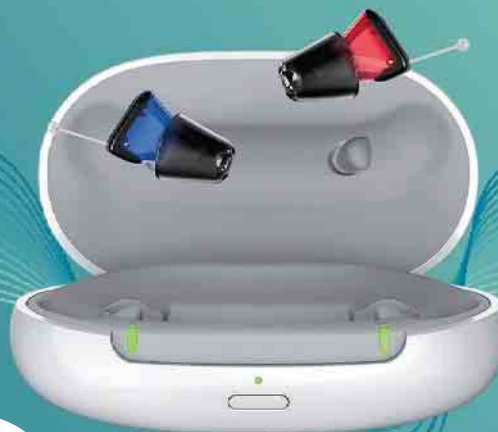
Silk Charge&Go IX

Die kleinsten wiederaufladbaren Hörgeräte der Welt.