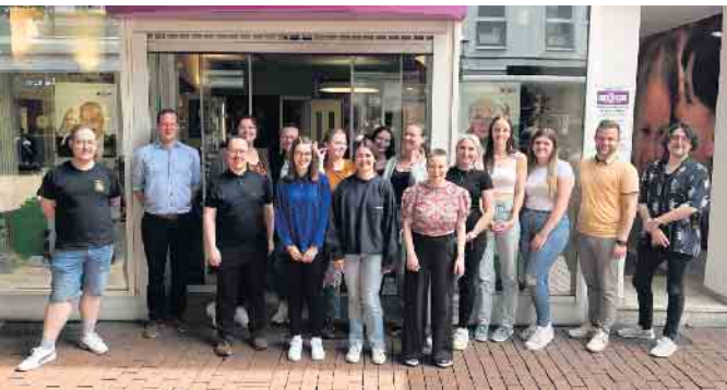
Gruppenfoto im Rahmen des Besuches der Logopädieschule Bonn bei BECKER Hörakustik am 21. Juni 2024

Förderung der interdisziplinären Zusammenarbeit beginnt schon in der Ausbildung