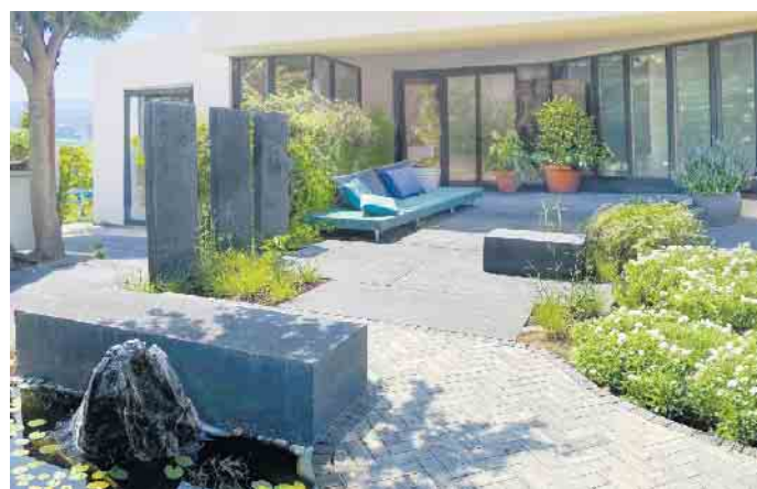
Anthrazitfarbene EXEO®-Platten, Stelen und Sitzblöcke in Kombination mit TARA®-Pflaster Platin.