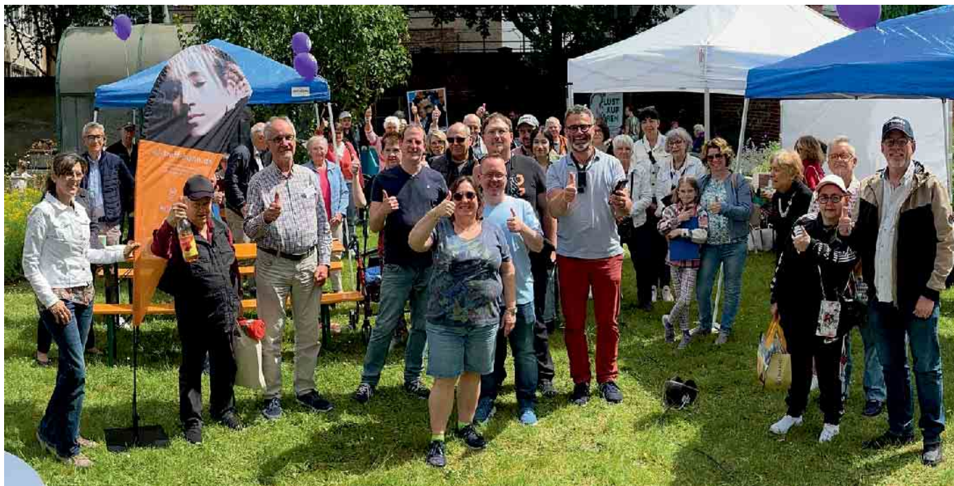
Gruppenfoto bei herrlichem Frühsommerwetter beim Grill- und Sommerfest des Bonner CI-Treff am 15. Juni