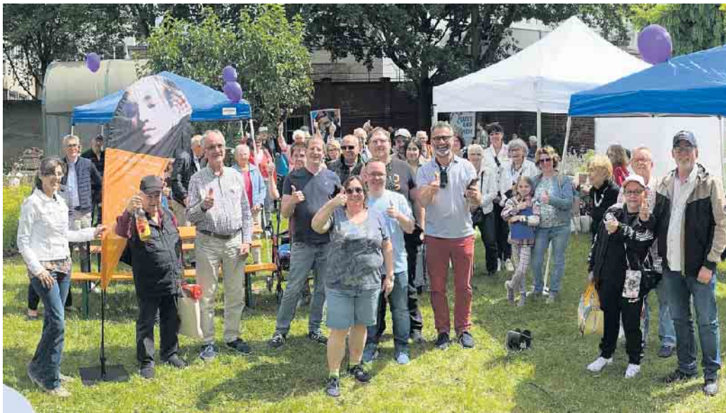
Gruppenfoto beim Sommer- und Grillfest 2024

Der Bonner Cochlea Implantat (CI)-Treff ist seit vielen Jahren eine wichtige Selbsthilfeplattform für CI-Träger und Interessierte im Raum Bonn. Ins Leben gerufen als