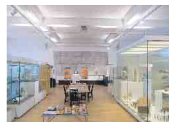
Sosiehtes noch am alten Standort aus

begutachtet, auf Schäden und Zustand geprüft, der Wert wird für die Versicherung ermittelt und schlussendlich werden alle Objekte transportfähig eingepackt. Da am neuen Standort die zur Verfügung stehende Ausstellungsfläche deutlich kleiner ist, wird schon beim Einpacken darauf geachtet, was in die erste Ausstellung ( voraussichtlich im Mai 2024) geht und was in das Archiv wandert. Die Schließung des Museums am jetzigen Standort ist für Juni/Juli 2023 vorgesehen. Bis zum Jahresende sind aber noch Führungen und Kinderveranstaltungen vorgesehen. Die Termine für diese Aktionen werden rechtzeitig bekannt gegeben.