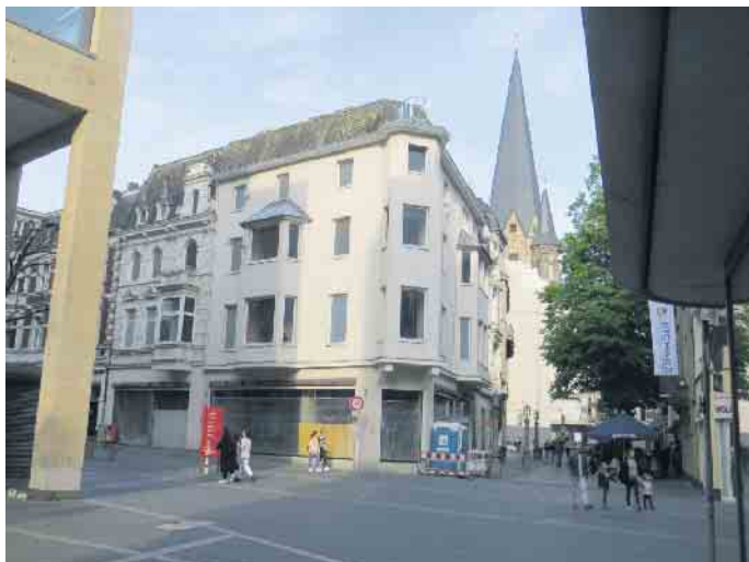
Neues Domizil in der Poststraße, Stand: Mai 2023

Das Ägyptische Museum der Universität Bonn wechselt den Standort