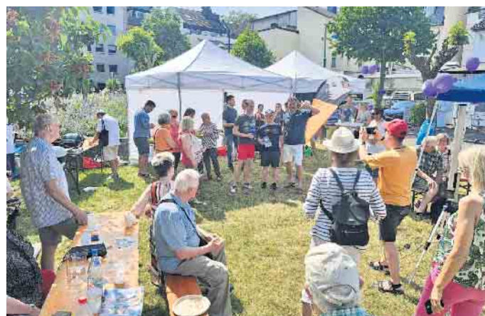
Sommer- und Grillfest des Bonner CI-Treff im Jahr 2023