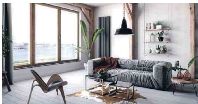
Eine energetisch optimierte Gebäudehülle mit Wärmedämmglas reduziert den Heizbedarf und auch die sommerliche Kühllast jedes Gebäudes.

(BAFA) oder Förderungen der Bundesländer und Kommunen. Weitere Informationen unter www.glas-ist-gut.de/energiesparen-mitglas und zu den Förderprogrammen unter www.bafa.de/beg und www.kfw.de . (akz-o)