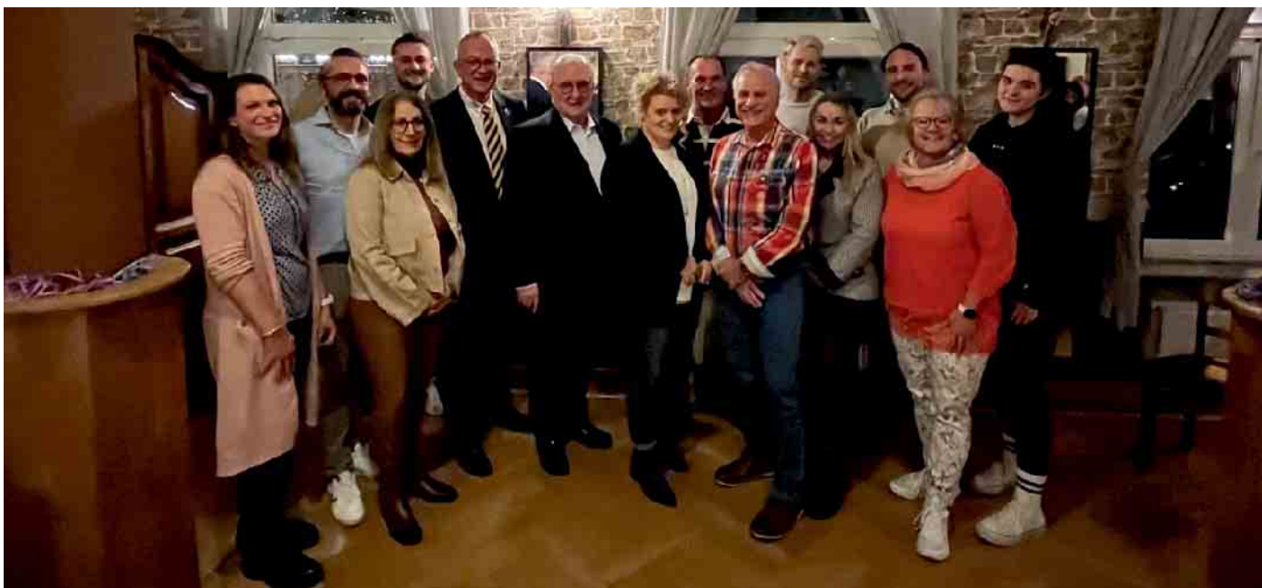
Der neue Vorstand der KG Blau Gold

Inmitten der Fastenzeit jährte sich die Jahreshauptversammlung der KG Blau Gold Muffendorf. Neben dem Bericht der Ge-