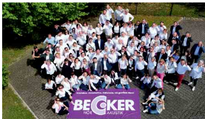
Gruppenfoto bei strahlendem Sonnenschein im Rahmen der 8. BECKER-Fortbildungsmesse

Bonn-Bad Godesberg BECKER Hörakustiker sind immer auf dem neuesten Stand der Technik Am vergangenen Samstag, den 13. April 2023 fand die 8. Fortbildungs-Hör-Messe von BECKER Hörakustik im Contel Hotel in Koblenz statt. Rund 100 der BECKER Hörakustikerinnen und Hörakustiker nutzten die Gelegenheit zum gemeinsamen Austausch und um sich bei Vorträgen und auf der Branchenausstellung über modernste Hörsystemtechnik zu informieren.