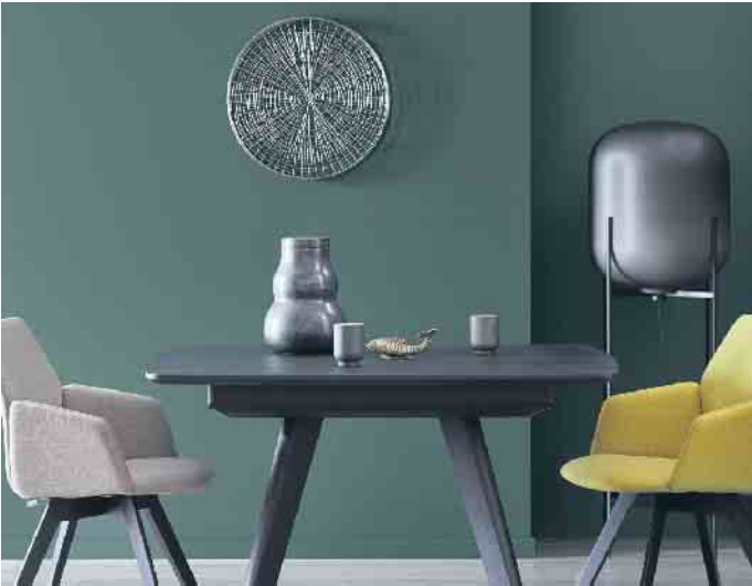
Der Dschungel in den eigenen vier Wänden: Der Name dieser Trendfarbe für die Wand ist hier Programm.

expertin und Fernsehmoderatorin Eva Brenner: „Die Farbe bringt Wärme in den Raum, lässt ihn erstrahlen und wirkt gleichzeitig zurückhaltend.“