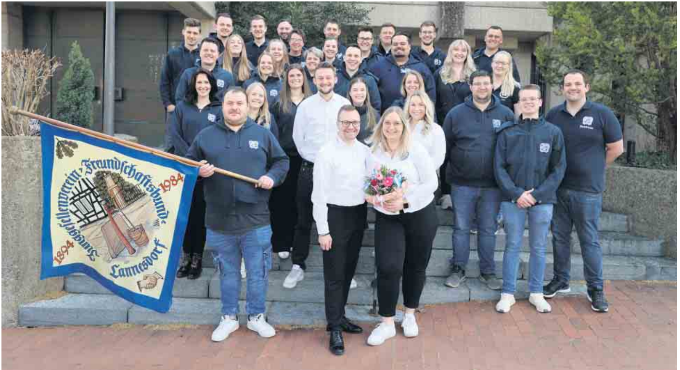
JGV Lannesdorf mit Maikönigs- und Begleitpaar