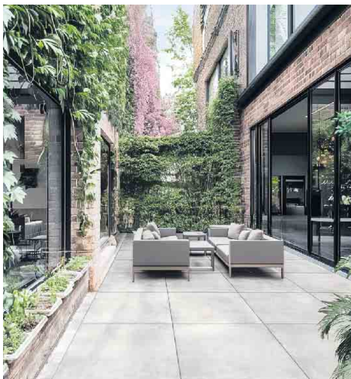
Verleihen dem Außenbereich urbanen Chic: PUREA®-Platten im Format 90x90 cm in Concrete Grey

Mehr Informationen unter www.koll-steine.de . CSH