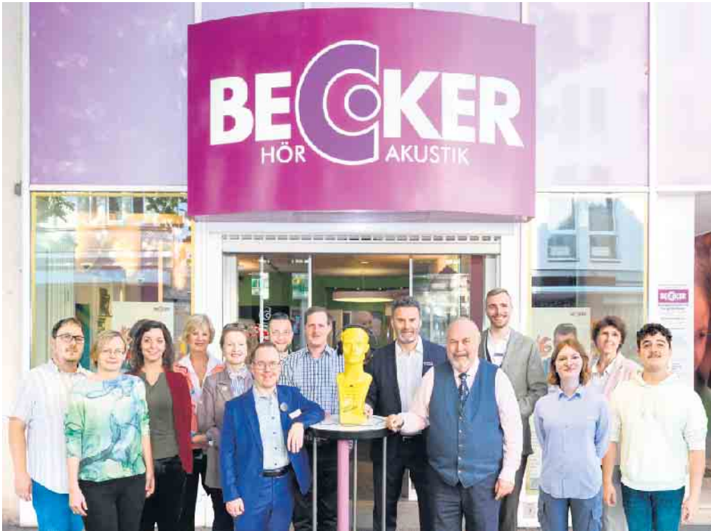
Das Team von BECKER Hörakustik vor dem Fachgeschäft in der Alten Bahnhofstraße