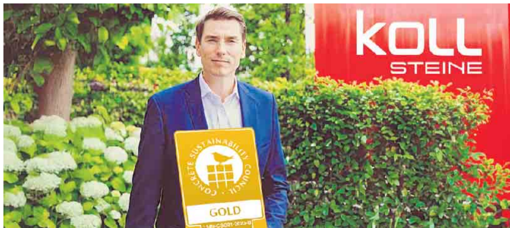
Ausgezeichnet für verantwortungsbewusste Produktion: KOLL Steine erhält Gold-Zertifikat

KOLL Steine setzt Maßstäbe in nachhaltiger Betonsteinherstellung: Das Werk in Bonn wurde mit dem Gold-Zertifikat des Concrete Sustainability Councils (CSC) ausgezeichnet - ein Beleg für verantwortungsbewusste Produktion. Durch den Einsatz von Sekundärmaterialien, erneuerbare Energien wie Solarstrom und gezielte Energieeinsparmaßnahmen senkt das Unternehmen seinen CO 2 -Fußabdruck nachhaltig. Verbleibende Emissionen werden kompensiert - ein wichtiger Schritt Richtung Klimaneutralität.