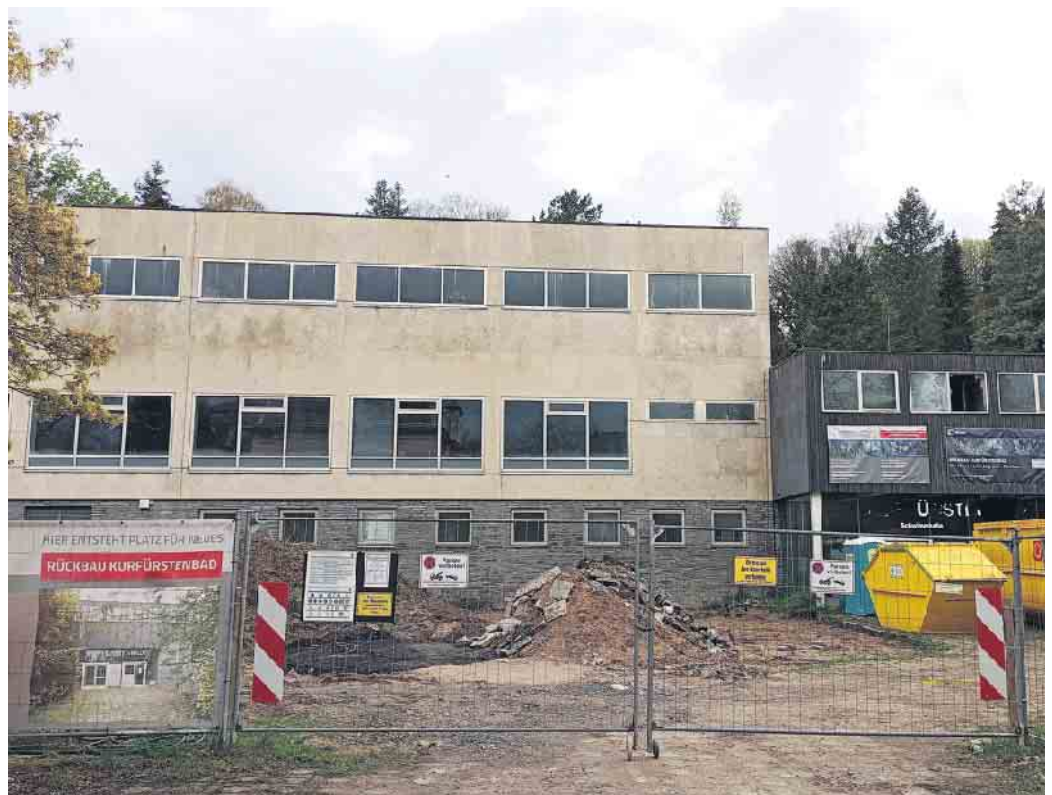
Erste Spuren der Rückbauarbeiten am Kurfürstenbad