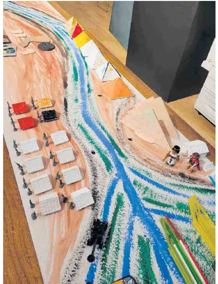
Flußverlauf des Nils

Die Zeichen werden unserer Schrift gegenübergestellt und auf verschiedene Weise geübt, z. B. mit dem eigenen Namen auf original Papyrus Streifen. Wird ein Rätsel in Hieroglyphen entschlüsselt, gibt es hierfür ei-