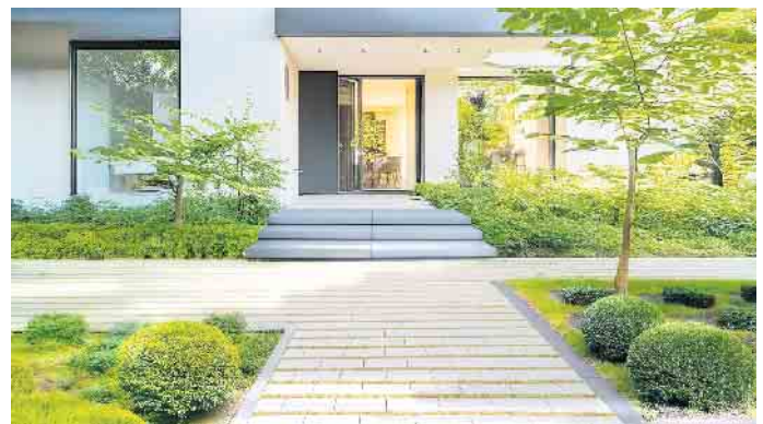
Tinella®Naturfuge - Platz für Grün, Wasser und mehr in der Fuge