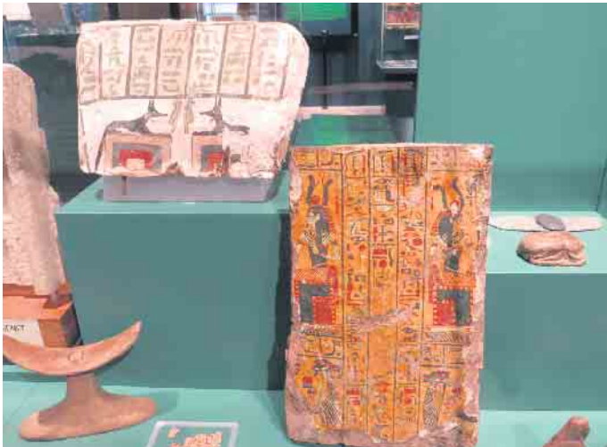
Tafeln mit Hieroglyphen Schrift

14 Workshop-Termine für Kinder ab sieben Jahren im März und April vom Förderverein des Ägyptischen Museums der Uni Bonn