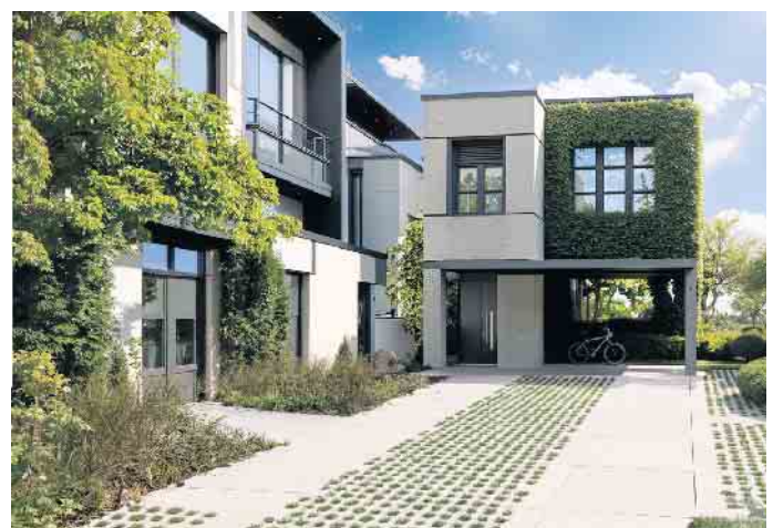
EXEO®Green - die moderne Lösung für nachhaltige Außenanlagen mit Format