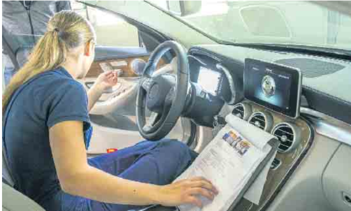
Ausbildungsberufe in der Kraftfahrzeugbranche bieten jungen Menschen gute Entwicklungschancen und zukunftssichere Arbeitsplätze.

Unter www.wasmitautos.de gibt es eine Vielzahl von Informationen zu den Berufsbildern und ihren Anforderungen sowie einen Betriebsfinder zur Suche nach Ausbildungsplätzen. Auch die Karriere-