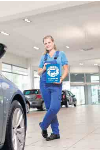
Meisterlich in die Zukunft: Trotz der aktuellen Veränderungen bietet die Mobilitätsbranche langfristige Sicherheit für Auszubildende und Arbeitnehmer

Die Mobilitätsbranche ist einem starken Wandel unterworfen. Elektrofahrzeuge werden zur Normalität, durch eine Vielzahl von Assistenzsystemen mit Sensoren, Radar- und Kamerasystemen und elektronischen Bauteilen werden die Fahrzeuge immer komplexer. Parallel sind innovative Mobilitätsformen wie das Carsharing oder flexible Auto-Abos den Kinderschuhen entwachsen. Für Menschen, die einen Beruf in der Kfz-Branche anstreben, eröffnen diese Entwicklungen neue Möglichkeiten und Chancen.