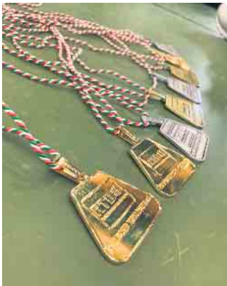
Medaillenregen bei den Mannschaftsmeisterschaften des RTB

Bronze-Medaille freuen. Zum Abschluss stand noch der Double Dutch Freestyle an, welchen die Drei mit einem besonders hohen Schwierigkeitsgrad abschlossen und sich gegenüber ihrer Mitkonkurrenten aus Wuppertal und Neuss die Goldmedaille sicherten sowie ebenfalls eine Qualifikation zum Bundesfinale. Nun heißt es weiter, üben bis zum ersten Maiwochenende, wo es für die drei Bonner Springerinnen nach Göttingen zum nächsten Wettbewerb, dieses Mal auf nationaler Ebene, geht.