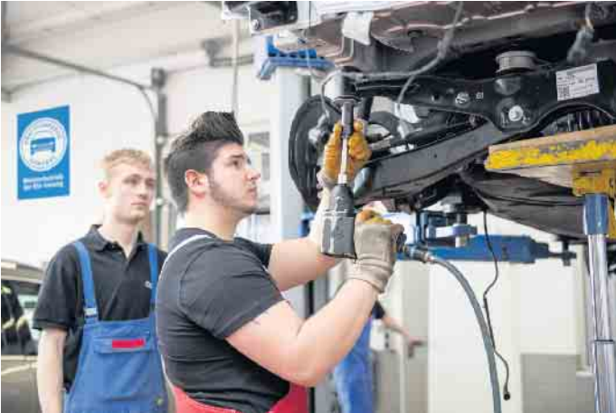
Der Kfz-Mechatroniker liegt bei jungen Männern auf Platz 1 der beliebtesten Ausbildungsberufe.

Wandel der Mobilitätsbranche bringt neue berufliche Herausforderungen