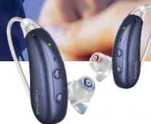
Motion Charge&Go IX

Weil Gespräche gemeinsame Momente schaffen.