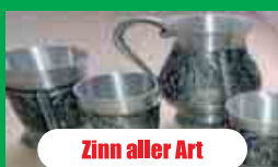
Zinn aller Art