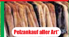
Pelzankauf aller Art*