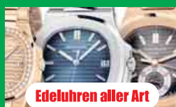
Edeluhren aller Art