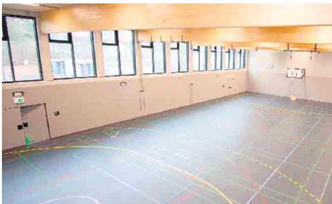
Eine moderne Sporthalle wurde in den Erweiterungsbau der Gotenschule integriert.