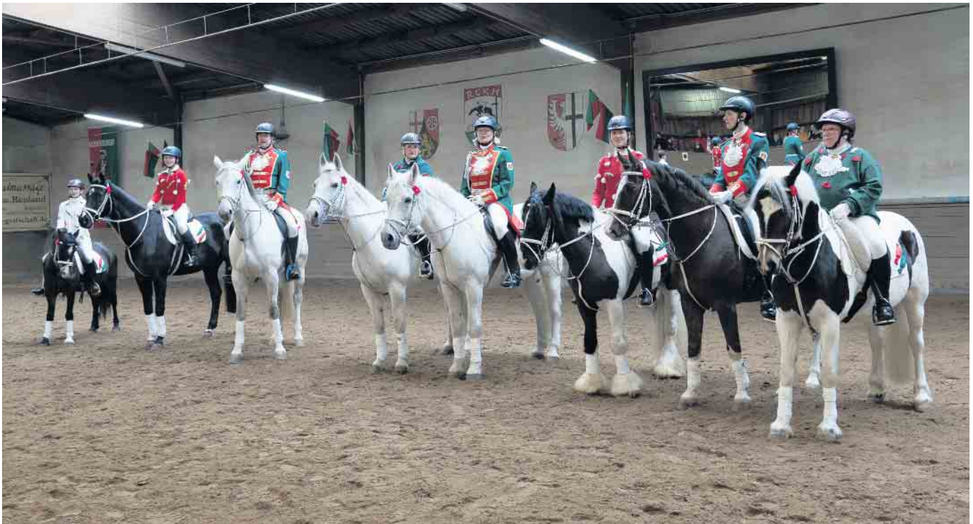
Kavallerie der Godesberger Stadtsoldaten