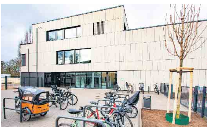
Außenansicht des Erweiterungbaus der Gotenschule. Vor dem Eingang stehen zahlreiche Anlehnbügel zum Abstellen von Rädern und Rollern.

in der Regel an fünf Tagen bis 16.30 Uhr eine Betreuung für momentan 174 Kinder in acht Gruppen. Diese Betreuung umfasst ein tägliches warmes Mittagessen, eine Hausaufgabenbetreuung, Freispiel und AG-Angebote. Bei Bedarf gibt es eine ganztägige Ferienbetreuung für bis zu sechs Wochen im Schuljahr. Zudem gibt