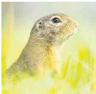
Europäischer Ziesel.

Fotoausstellung des Naturfototreff Eschmar im Museum Koenig