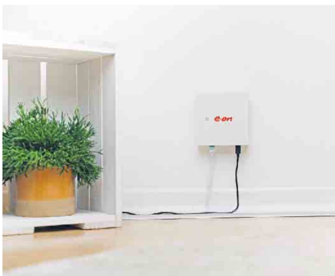
Mehr Transparenz über die eigene Stromerzeugung und den Verbrauch: Moderne Technologie macht es möglich.