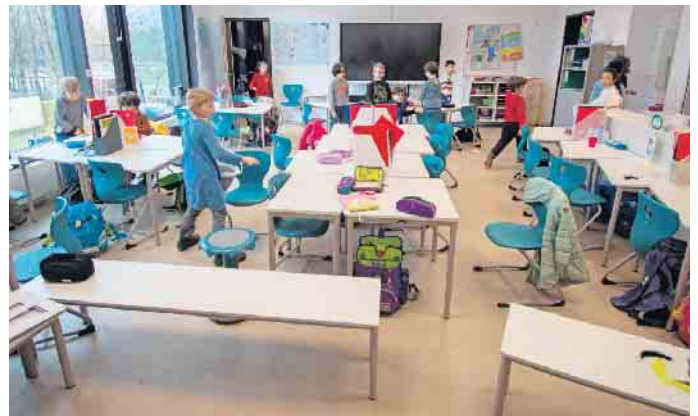
Blick in einen der Klassenräume, die dank großer Fensterfronten sehr hell sind.

Um den Schüler*innen und Lehrkräften zukunftsorientierte und optimale räumliche Bedingungen zu bieten und den steigenden Bedarf an Schulplätzen zu decken, investiert die Bundesstadt Bonn fortlaufend in die Sanierung und Erweiterung ihrer Schulen. Zum Schuljahresbeginn 2024/2025 konnte an der Gemeinschaftsgrundschule Gotenschule in Plittersdorf (Stadtbezirk Bad Godesberg) ein klimafreundlicher Erweiterungsbau in Betrieb genommen werden. Mit der Anfang 2025 nun auch erfolgten Fertigstellung der Außenanlagen ist das gesamte Bauprojekt erfolgreich beendet worden. Oberbürgermeisterin Katja Dörner und Rachid Jaghough, Betriebsleiter des Städtischen Gebäudemanagements, nahmen dies zum Anlass, sich vor Ort gemeinsam mit Schulleiterin Judith Reichert bei einem Rundgang über den Neubau zu informieren. „Der Erweiterungsbau der Gotenschule ist für die Schulgemein-