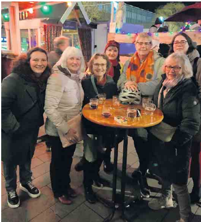
Nikolausmarkt Bad Godesberg

Das Glühweintreffen war auch in diesem Jahr ein gelungener Auftakt für die bevorstehenden Veranstaltungen des Netzwerks. Als nächstes steht das traditionelle Neujahrsfrühstück am 7. Januar auf dem Programm. Im Café des Restaurants Cassius Garten treffen sich die Bonn Femmes, um Pläne für 2026 zu schmieden, aktuelle Termine zu besprechen und das neue Jahr gemeinsam zu beginnen. Das Netzwerk Bonn Femmes bleibt ein inspirierender Treffpunkt für beruflich selbstständige Frauen, die sich gegenseitig unterstützen, Ideen austauschen und gemeinsam wachsen wollen.