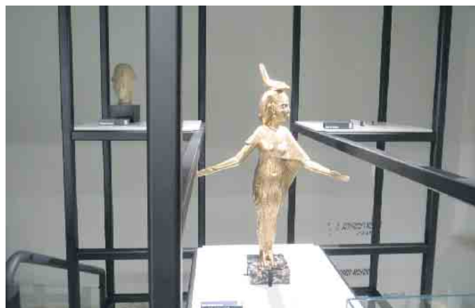
Schon im Treppenaufgang sieht man tolle Objekte.

Der Namen wird dann auf einen original Papyrus Streifen geschrieben und so ein persönliches Lesezeichen erstellt. Die Kinder bekommen dann einen Hieroglyphen Text, der entschlüsselt werden soll. Danach wird bei einem Rundgang durch das Museum die Schrift an Original Objekten gezeigt. Für eine kleine Pause bitte etwas zu essen oder trinken mitbringen. Über eine Spende von 15 Euro als Kostenbeitrag für Material, Führung und Gebühren würden wir