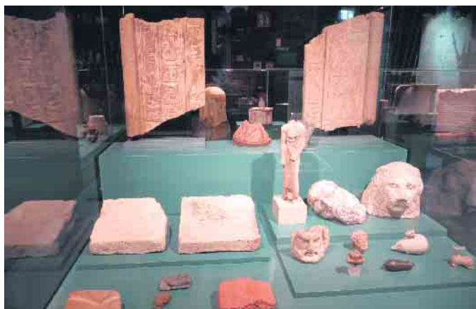
Bild aus dem neuen Museum

Auch im neuen Jahr finden spannende Kurse für Kinder statt.