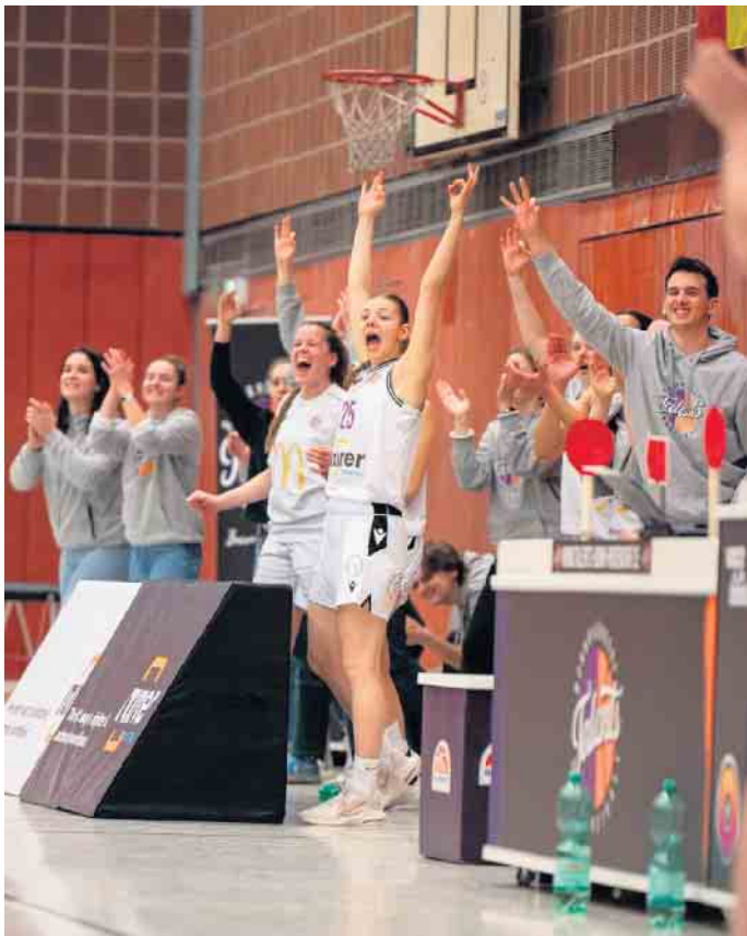
Jubeln konnten die Talents bei Ihren Heimspielen im Pennenfeld zuletzt häufiger.