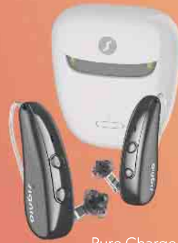
Pure Charge&Go IX

Die weltweit ersten Hörgeräte mit Multi-Beamformer-Technologie und 2-Wege-Signalverarbeitung.