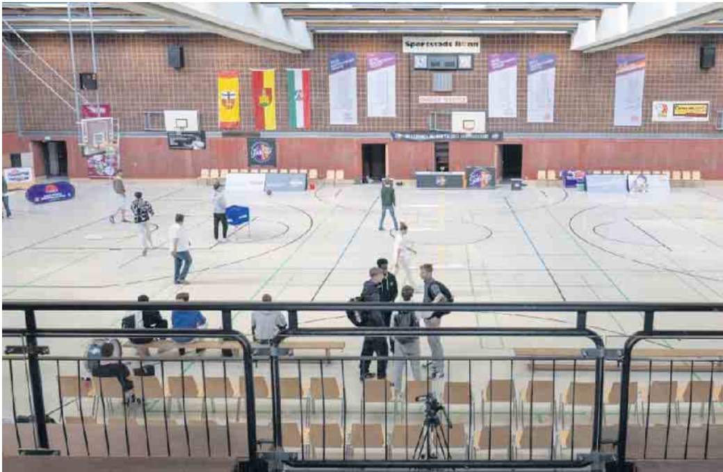
Bis das Pennenfeld für ein Bundesligaspiel nutzbar ist, ist viel Handarbeit von Nöten

Selbst die zur Durchführung der Punktspiele vorgeschriebenen 300 Sitzplätze erreicht man nur, weil vom Sport- und Bäderamt städtische Stapelstühle angeliefert werden. Die aber auch nicht vor Ort gelagert werden dürfen. Städtisches Material in einer städtischen Sporthalle zu verstauen, das übersteigt eindeutig die Grenzen des Machbaren. So haben sowohl der Sportausschuss als auch der Betriebsausschuss des Rates im Oktober parteiübergreifend die Verwaltung aufgefordert, einen Raum herzurichten und zur Nutzung zu übergeben. Bisher ohne Vollzugsmeldung. Der Amtsschimmel wiehert dabei aus allen Lagen, Leidtragender sind die Talents.