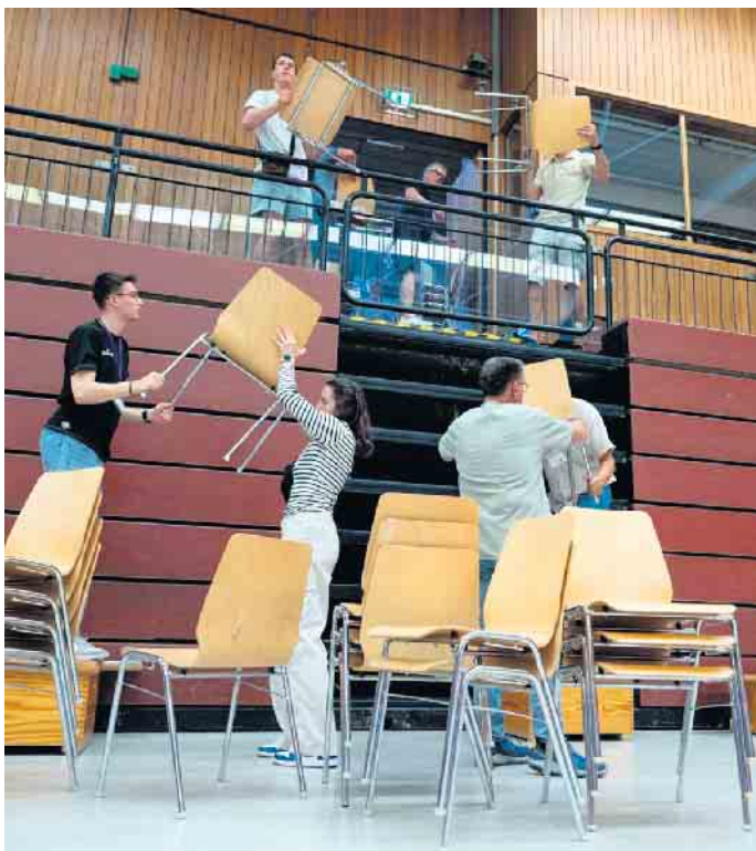
Alle helfen mit um die Stühle aus der Halle zu schaffen

Wollen Sie Streit in der Familie vermeiden?