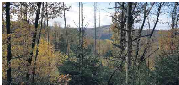
Ausblick auf den umliegenden Wald

befindet sich auf dem Rückzug aus dem Oberbergischen. In den nächsten Jahren möchten wir nachweisen, dass gute Ersatzmaßnahmen dieser Charakterart weiterhelfen können.