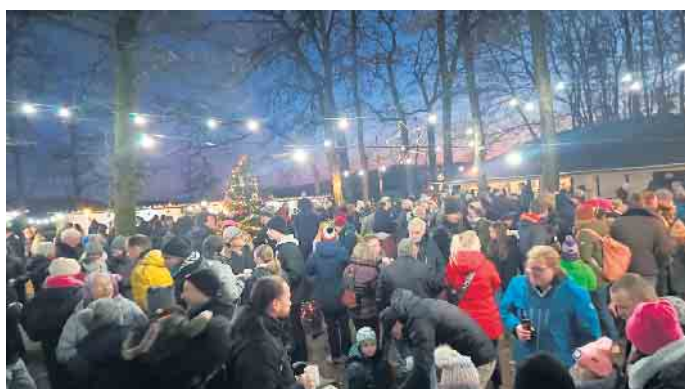
Besucher auf dem erleuchteten Waldfestplatz

stöbern, was es Tolles an unseren ausgewählten Ständen gibt. Dazu gibt es ein buntes Rahmenprogramm, eine Tombola, Auftritt „Die älteste Boygroup aus Vilkerath“ und vieles mehr. Weihnachtlichen Spaß für die ganze Familie! Bitte unbedingt im Kalender vermerken und auch allen Nachbarn, Freunden und Familienmitgliedern weitersagen.