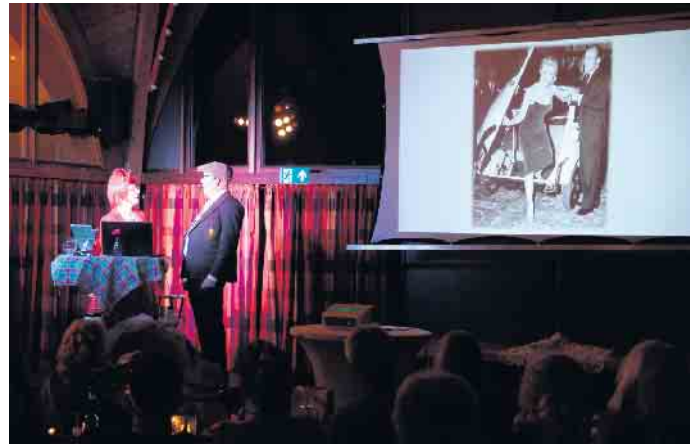
Präsentation alter Fotodokumente

ich nachsitzen musste, kam ich zu spät und alle Ponys waren weg.“ Stattdessen wurde ihm eine Kette in die Hand gedrückt und so wurde er zum Kameltreiber. Winter fand es unglaublich, dass damals die vielen Tiere von Jugendlichen ohne Sicherungsmaßnahmen über die Hauptstraße geführt werden durften, hatte aber gleich auch einen Witz parat: „Was ist der Unterschied zwischen einem Kamel und einem Mann? - Ein Kamel kann eine Woche lang arbeiten ohne zu saufen, bei einem Mann ist es genau umgekehrt.“ Eine der größten Errungenschaften damals war natürlich das Fernsehen und das Publikum stimmte begeistert in die Intros von Flipper und Bonanza ein. Mit dabei war auch das HB-Männchen Bruno und dem unvergess-