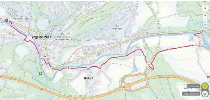
Machbar, aber mit Umweg: Route über Haus Ley

Wann kommt der neue Radweg von Engelskirchen nach Runderoth?