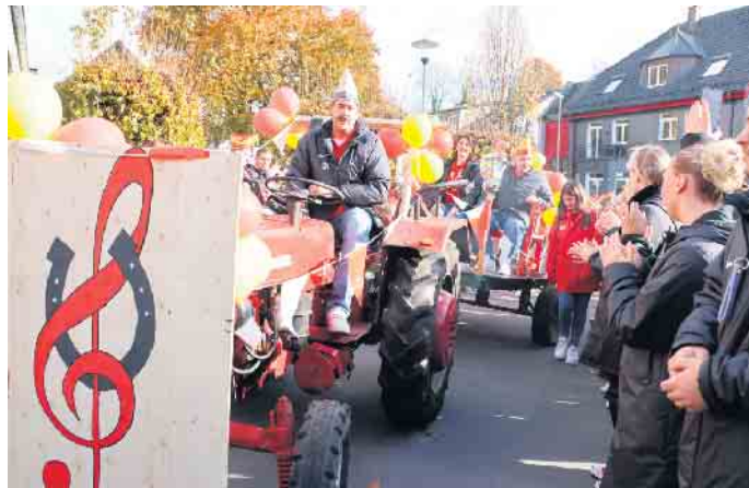
Die Jecken applaudieren im Spalier.