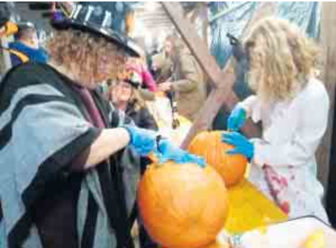
Kürbisse werden vorbereitet.

Gemütlicher, familiärer Weih- nachtsmarkt am 29. November, ab 15 Uhr. Die Vereinsmitglieder haben den Eichenwald umdeko- riert und ein himmlisches Rah- menprogramm für Euch zusam- mengestellt.