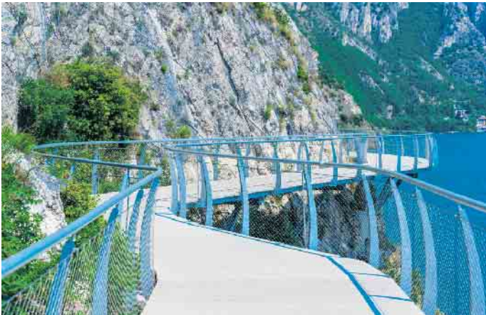
Kaum durchsetzbar: aufgeständerter Radweg neben den Gleisen (Beispielfoto)

Haus Ley führt (siehe Karte). Leider fand diese Route keine mehrheitliche Zustimmung. Tatsächlich ist die Strecke landschaftlich reizvoll, hat aber auch Nachteile: Sie macht einen Umweg und impliziert eine - allerdings moderate - Steigung. Viel besser wäre die Route, die ein Planungsbüro für die zuständige Behörde „Straßen NRW“ entwickelt hat. Sie führt nördlich der Bahngleise über einen neu zu schaffenden, aufgeständerten Weg bis zum Fitness Center (s. Beispielfoto). Doch diese Variante wird wohl in absehbarer Zeit nicht verwirklicht werden können. Das Gelände gehört der Bahn, die dem Bau eines Radwegs