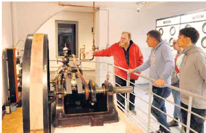
Die Dampfmaschine hat die Wasserturbinen bei der Stromerzeugung ergänzt.

Die Tonaufnahme einer laufenden Turbine vermittelte den Gästen im früher mit Aggerwasser gefluteten Keller einen plastischen Eindruck davon, wie die zwei Francis-Doppelturbinen den Strom für die Fabrik erzeugten - selbst bei dem heutigen Verbrauch könnten damit rund 700 Haushalte versorgt werden. Beim Drehzahlregler in der Etage darüber erinnerten in Glasbehälter abgefüllte Öle und Schmierfette daran, wie die Maschinen in der Fabrikhalle gerochen haben. Im Nebenraum, wo das von der Königswelle der Turbinen angetriebene Schwungrad über einen breiten Lederriemen den Synchron-Generator in Drehung versetzte, berichtete Hanf über die Arbeit in der früheren Spinnerei. Während die Frauen ständig da-