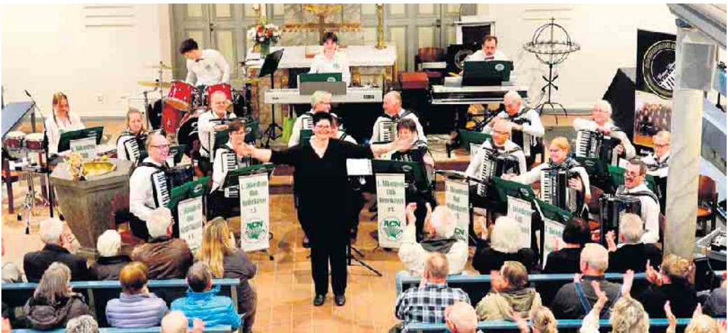
Ründeroth Akkordeonkonzert.