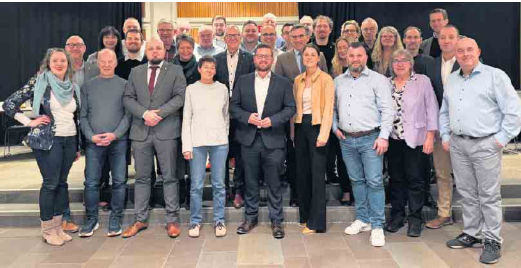
Die neugewählten Ratsmitglieder der Gemeinde Engelskirchen