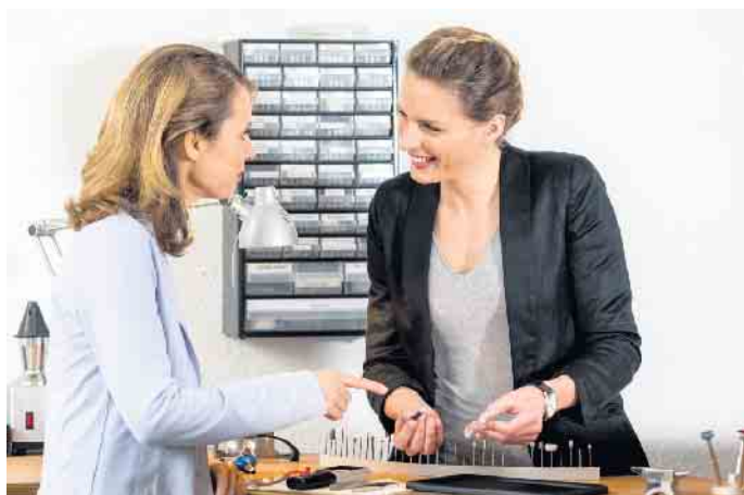
Anpassung und Beratung von Hörsystemträgern.

bleibt oft lange unbemerkt. Daher empfehle ich allen ab dem 50. Lebensjahr, einen kostenlosen Hörtest beim Hörakustiker vor Ort zu machen. Ein Hörtest gibt Auskunft über das persönliche Hörvermögen.“