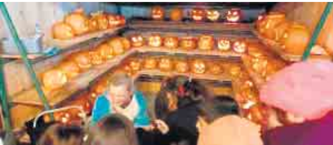
75 geschnittene Kürbisse