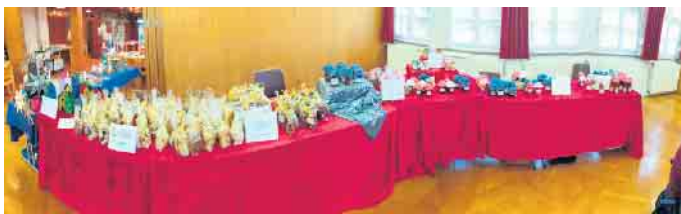
handgemachte Köstlichkeiten zum Verkauf

Am Samstag und Sonntag, 4. und 5. November, findet in Ründeroth der Martinsmarkt statt.