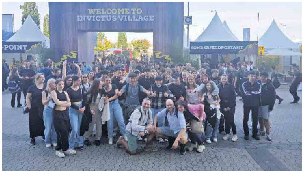
Schüler und Schülerinnen bei den Invictus Games 2023

Es war Dienstagmorgen, der 12. September 2023. Die Schülerschaft und das Kollegium der Sekundarschule im Walbachtal machten sich per Bus auf den Weg zu den internationalen paralympischen Spielen , die seit 2014 alle zwei Jahre in unterschiedlichen Städten auf allen Kontinenten ausgetragen werden. In diesem Jahr fanden sie in Düsseldorf statt. Athleten aus 21 Ländern maßen sich in zehn unterschiedlichen Disziplinen. Das Ziel der Invictus Games, welche durch den britischen Prinzen Harry initiiert wurden, ist es, den inklusiven und integrativen Charakter des Sports hervorzuheben. Der Sport ermöglichte den Athleten, die im Dienst für ihr Land verletzt wurden, die Rückkehr zum sozialen, gesellschaftlichen und familiären Leben. Unsere Schülerschaft konnte das Ringen um Medaillen in zwei Sportarten verfolgen: Rollstuhlbasketball und Rudern. Unter tausenden von Zuschauern und mit vielen Emotionen konnten sie nicht nur den Wettstreit um die ersten Plätze beobachten, sondern vor allem sehen, wie es möglich wird, trotz physischer und psychischer Handicaps körperliche Hochleistung erreicht werden. Außerdem beobachteten unsere