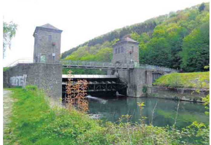
Hinter dem Wehr verläuft der Vogelweg

Ende: Aus der Arbeit der Parteien Bündnis90 / Die Grünen