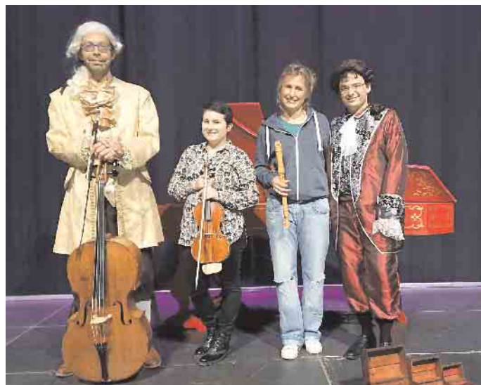
Ensemble Nel Dolce