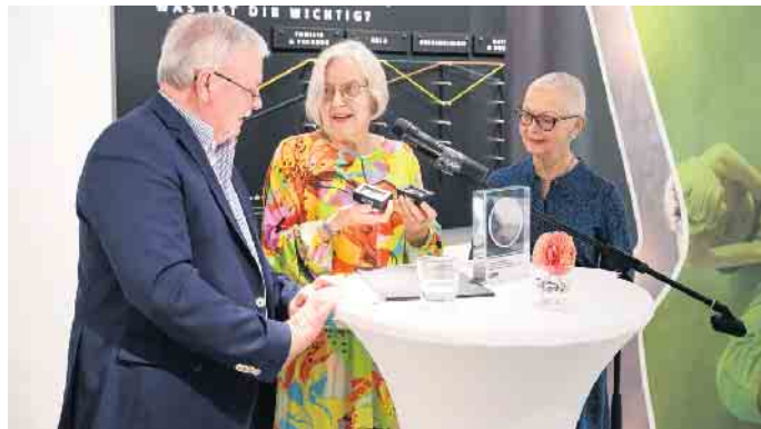
Übergabe der Auszeichnung im LVR-Industriemuseum

Weitere Informationen zum Verein der Freunde und Förderer des Kraftwerks Ermen & Engels finden Sie online unter foerderverein-kraftwerk-engelskirchen.de .