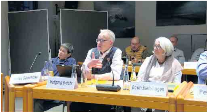
Ratssitzung 18.10.2023 | Gemeinde Engelskirchen 798 Aufrufe vor 4 Tagen · Mehr Gemeinde Engelskirchen · 54 6 · Teilen · Hierunterladen · Speichern