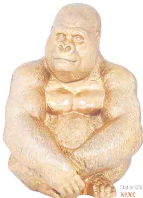
Statue KONG 43cm 149,90€

LEUCHTENFORM, Edmund-Schiefeling-Platz 5, 51766 Engelskirchen