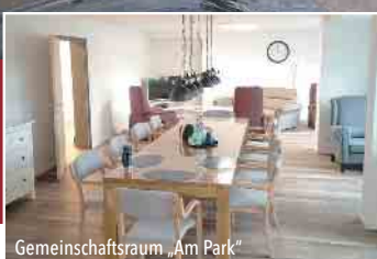
Gemeinschaftsraum „Am Park“