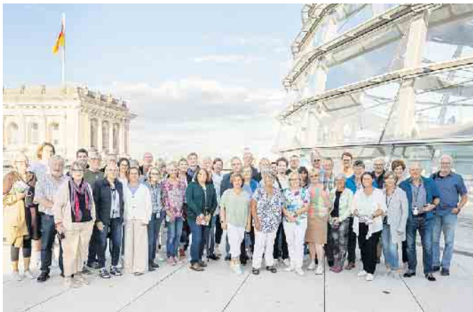
Grüne Oberberg auf dem Dach des Reichtags

Wir haben anschließend die ehemalige Staatssicherheit Untersuchungshaftanstalt Hohenschönhausen besucht. Dort wurde uns erst ein Dokumentationsfilm über die Anlage gezeigt. Darauf folgte ein Rundgang mit einem damals inhaftierten Zeitzeugen. Seine Er-