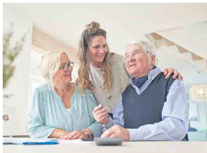
Eine Eigentumswohnung für die Kinder kaufen: Dieses Finanzierungsmodell ist bei Immobilienbesitzern und Banken gleichermaßen beliebt.

blick über Finanzierungslösungen verschaffen oder sie von einem ungebundenen Vermittler vergleichen lassen. Zum Beispiel unter www.drklein.de gibt es weitere nützliche Tipps rund um die Finanzierung von Zweitimmobilien und eine Kontaktmöglichkeit. (djd)