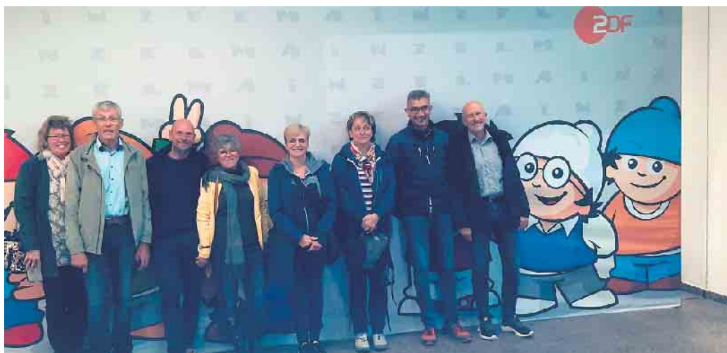
Die Mainzelmännchen aus Engelskirchen

und ca. 100 Scheinwerfer zur optimalen Ausleuchtung, ist Heimat des Aktuellen Sportstudios. Der Einsatz der Technik wurde anschaulich erklärt. Danach ging es