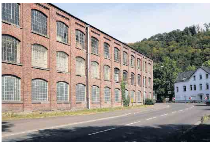
Die Zukunft ist wieder offen: Alte Bücherfabrik Ründeroth

Ende: Aus der Arbeit der Parteien Bündnis90 / Die Grünen