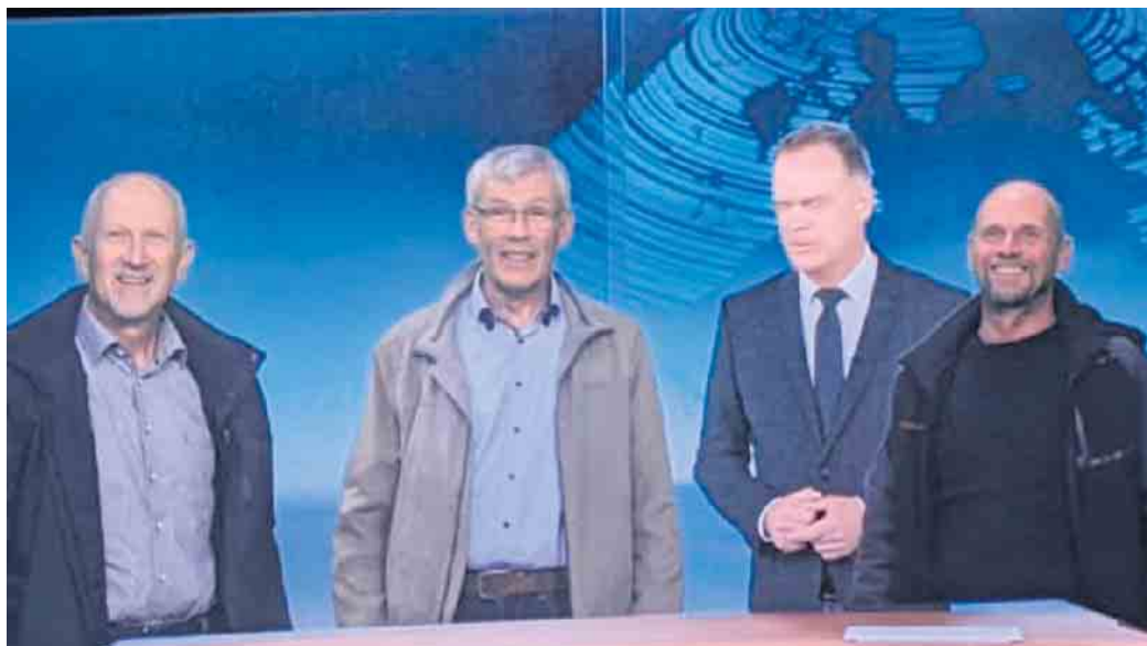
Team heute journal.

Es folgte eine spannende Führung durch zwei Studios. Die kleineren Studios sind für Nachrichtensendungen, Drehscheibe u.a. vorgesehen, das große Studio, mit Platz für rund 200 Zuschauer