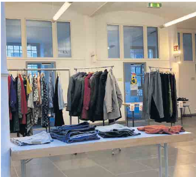
Kleidertausch im Rathaus

In der vergangenen Woche konnte nach der erzwungenen „Corona-Pause“ der Tausch von Kleidung in einer besonderen Aktion wieder aufgenommen werden, dieses Mal im Foyer des Rathauses in Engelskirchen. Viele Bürger und Bürgerinnen waren dem Aufruf gefolgt und brachten gut erhaltene Kleidungsstücke. Im geräumigen Foyer konnten diese sehr gut platziert werden und das Foyer verwandelte sich schnell in einen gut gefüllten Laden. Die Stimmung war ausgezeichnet. Es war schön zu sehen, wenn Lieblingsstücke in neue gute Hände kamen. Es gab viele gute Gespräche und Zuspruch zur Tauschaktion. Die Fairtrade Steuerungsgruppe möchte diese Aktion im Frühjahr wiederholen und aus Fast-