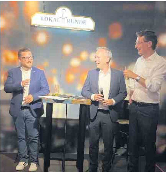
Bild: Bürgermeisterkandidat Lukas Miebach (links), Landratskandidat Klaus Grootens (Mitte) und Ministerpräsident Hendrik Wüst spielen sich beim lockeren Kneipen-Talk die Bälle zu.