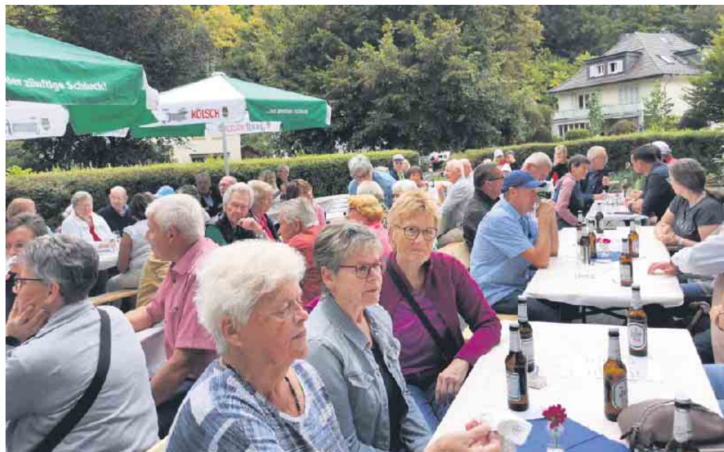
Gute Laune bei guter Musik im Ränderother Kurpark.