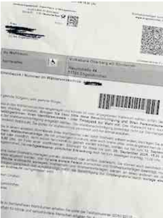
Wahlbenachrichtigung verlegt - trotzdem wählen gehen!