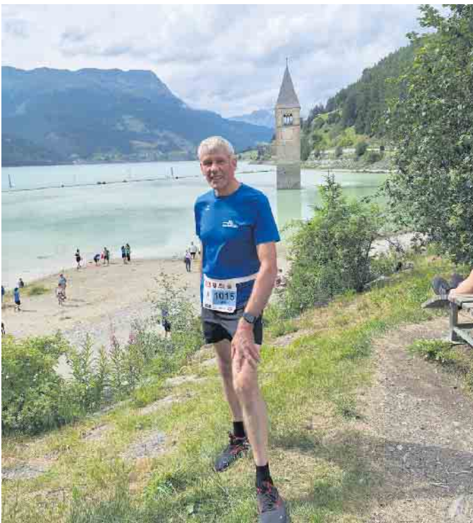
Heinz am Reschensee.

ken wechselten mit Sonnenschein ab. Der Ausblick auf die herrliche Bergkulisse mit dem 3.905 m hohen Ortler, dem höchsten Berg Südtirols, versüßten die Strapazen. Die 24. Ausgabe dieser Veranstaltung war professionell organisiert. Das übliche Rahmenprogramm mit Markt, Festzelt, Musik und Unterhaltung sowie ein Abschlussfeuerwerk rundeten das Laufevent ab. Die 2.214 Läufer und Läuferinnen wurden in drei Startblöcken auf die Reise geschickt. Unterschieden wurde zwischen