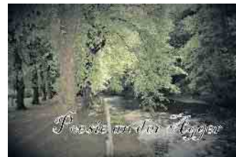
Poesie an der Agger Part 2

operation mit den Oberstaatskünstlern Manuele Klein und Detlev Weigand