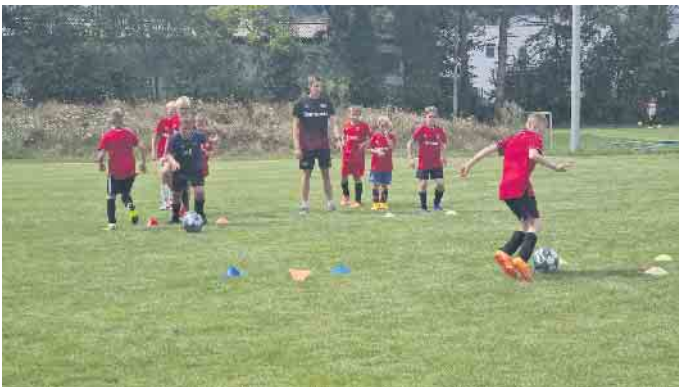
Training wie bei den Profis

Zum zweiten Mal wurde auf dem Sportgelände ASC Loope ein Fußball-Trainingscamp für Jugendliche der Jahrgänge 2007