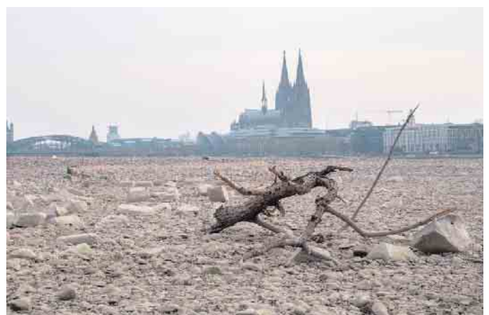
Köln am Rinnsal

Wann kriegen wir endlich den Arsch hoch?