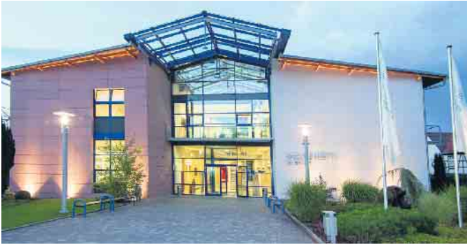
Das Bundesausbildungszentrum der Bestatter.