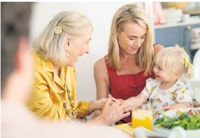
Mitten im Leben: Ein Cochlea-Implantat kann das Hörvermögen wieder herstellen, wenn Hörgeräte nicht mehr ausreichen.

Und so funktioniert es: Ein Cochlea-Implantat sendet elektrische Signale über den Hörnerv an das Gehirn. Dadurch können Klänge klarer und deutlicher wahrgenommen werden. Unterhaltungen werden wieder möglich, ebenso Telefonieren, gutes Verstehen beim Fernsehen und häufig sogar Musikgenuss. Um das zu erreichen, wird in einer Routine-OP ein winziger Elektrodenträger in die Hörschnecke eingesetzt. Hinzu kommt ein äußerer Soundprozessor. Er wird inzwischen oft nicht mehr am Ohr, sondern dezent am Hinterkopf getragen, wo er magnetisch direkt auf der Kopfhaut hält. Praktisch ist, dass sich das Implantat kabellos mit dem Smartphone, Tablet oder Fernseher koppeln lässt. Außerdem kann man es sogar beim Duschen oder beim Schwimmen nutzen. Studien zeigen, dass Cochlea-Implantat-Träger bereits sechs Monate nach der Operation meist sehr viel besser verstehen. Nach einem Jahr