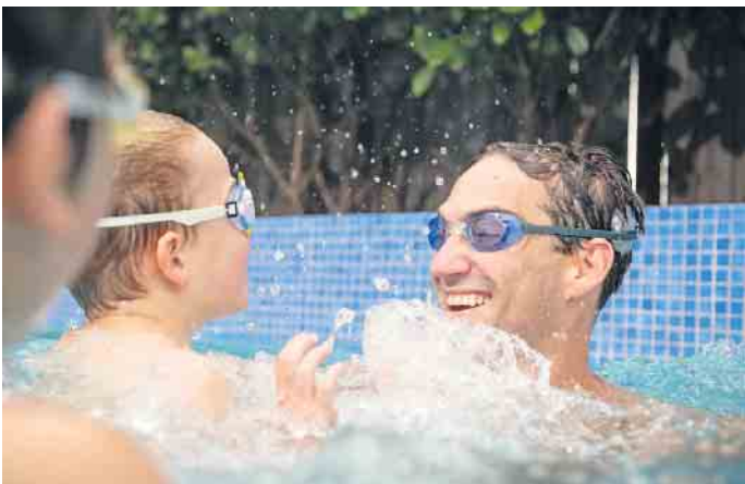
Alltagstauglich: Das Cochlea-Implantat darf mit Schutzhülle sogar mit ins Wasser.

verstehen sie durchschnittlich 55 Prozent mehr als zuvor mit Hörgeräten. Die Kosten für ein Cochlea-Implantat trägt in der Regel die gesetzliche Krankenkasse. (djd)