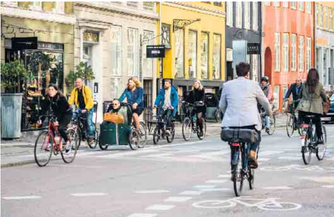
Wo der König Lastenfahrrad fährt: Kopenhagen

Ziemlich viele Dinge in unserem Alltag werden gerade als politisches Statement wahrgenommen: Wärmepumpen, E-Autos, Fahrradwege, SUVs, Currywurst, Windräder. Fahrradfahren gilt als links,