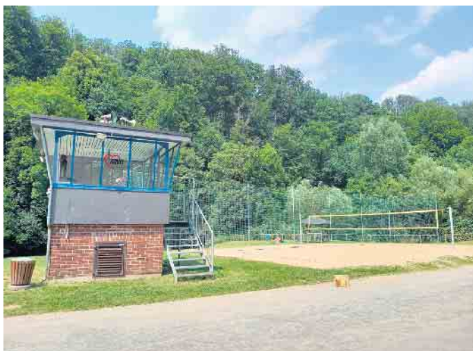
Freizeit am Aggerstrand in Runderoth

Um Kindern und Jugendlichen in unserer Gemeinde gute Zukunftschancen zu ermöglichen, bedarf es einer guten Infrastruktur an Schulgebäuden. Diese haben wir