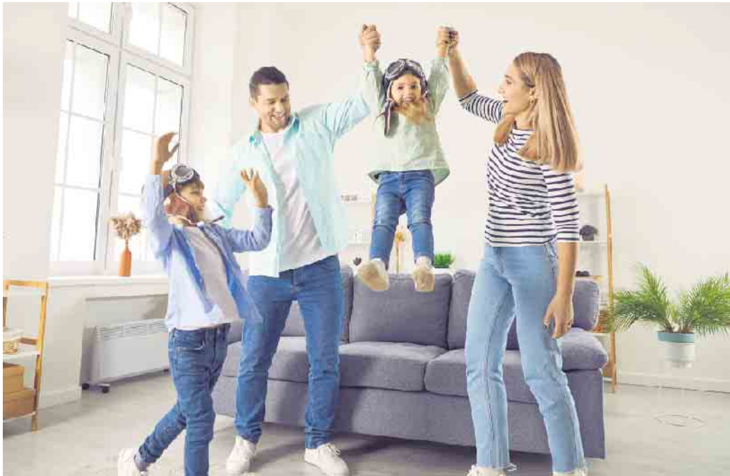
Mehr Lebensluft mit gesunder Raumluft: Lüftungsanlagen führen Schadstoffe zuverlässig ab und halten dank Filtertechnik Pollen und Feinstaub draußen.

Die effiziente Filtertechnik der kontrollierten Wohnungslüftung verhindert, dass Feinstaub, Pollen