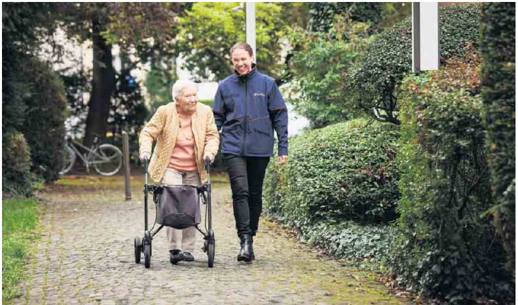
Die ehrenamtlich Helfenden bringen nicht nur ein offenes Ohr mit, sondern gehen einfühlsam auf die individuellen Lebenssituationen von älteren oder hilfsbedürftigen Menschen ein.