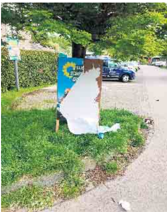
Dazu gehört kein Mut: zerstörtes Wahlplakat in Runderoth

Wir würden wirklich gern wissen, was ihr gegen uns habt. Aber wenn ihr nur unsere Plakate abreißt, werden wir es nie erfahren. Darum habe ich eine Bitte: Nehmt Kontakt zu uns auf. Ruft uns an oder schreibt uns eine Mail. Die Kontaktdaten findet ihr auf unserer Homepage. Sagt uns knallhart ins Gesicht, was euch an uns nervt. Nehmt kein Blatt vor den Mund. Aber haltet es dann bitte auch aus, wenn wir euch sagen, warum wir vieles, was ihr sagt und tut, bescheuert finden. Ich bin gespannt, ob ihr euch meldet und ob es zu einer Diskussion kommt. Ich fänd es toll, wenn wir uns mal austauschen könnten. Meinen Respekt hättet ihr. Denn für seine Meinung einzustehen,