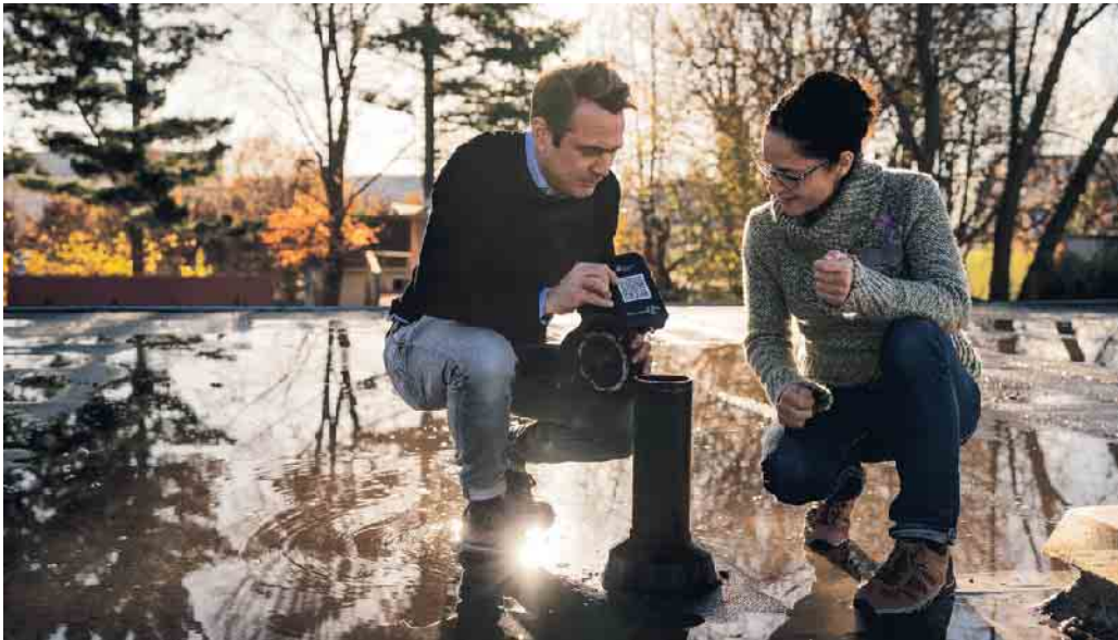
Intelligente Dachlösungen: Von Dachdeckern für Dachdecker entwickelt.

Das Dachdeckerhandwerk, ein traditioneller Bauberuf, erlebt in den letzten Jahren eine bemerkenswerte Renaissance dank innovativer Projekte und seiner Bedeutung für den Klimaschutz. Dachdecker und Dachdeckerinnen engagieren sich für Nachhaltigkeit, entwickeln neue Ideen und zeigen damit ihre Fähigkeit, sich den modernen Herausforderungen anzupassen.