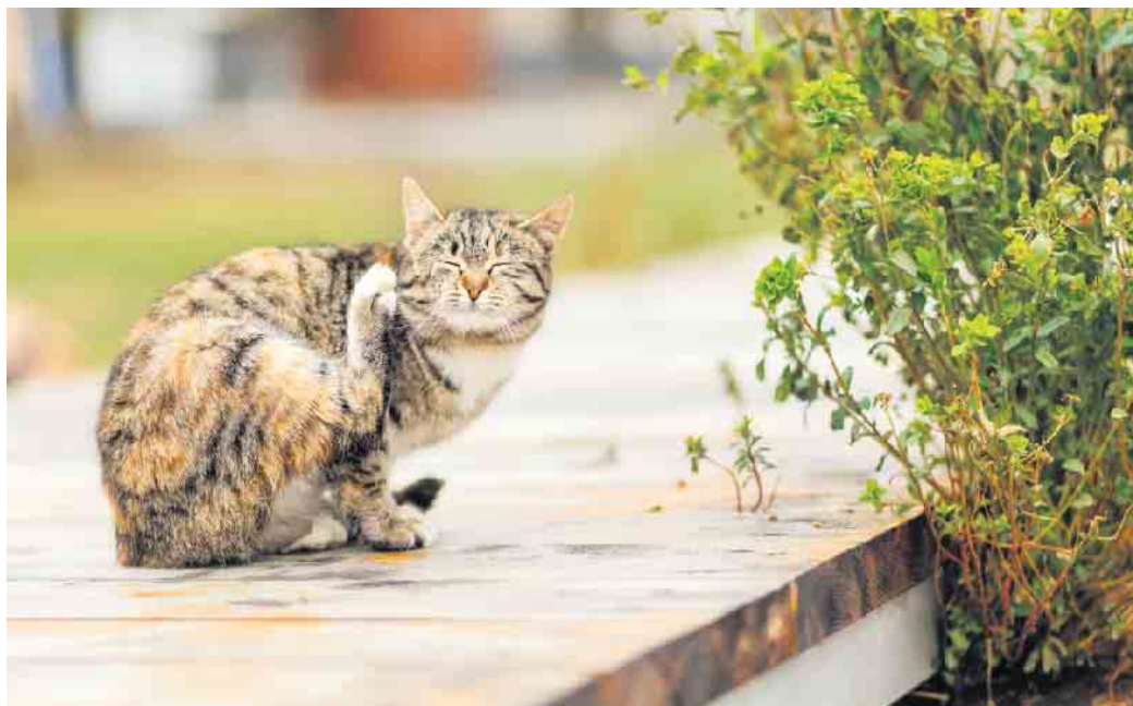
Juckreiz ist ein leidiges Thema. Gerade Katzen sollte man gut beobachten, da sie sich für das Kratzen häufig zurückziehen.

Zunächst sollten sich Besitzerinnen und Besitzer bewusst machen, dass der Juckreiz meist nicht die Krankheit selbst ist, sondern lediglich das sichtbare Symptom einer möglicherweise chronischen Erkrankung. Häufig verbergen sich Allergien hinter den Beschwerden. Aber auch Unverträglichkeiten, Parasitenbefall sowie andere körperliche und psychische Probleme können der Auslöser sein.