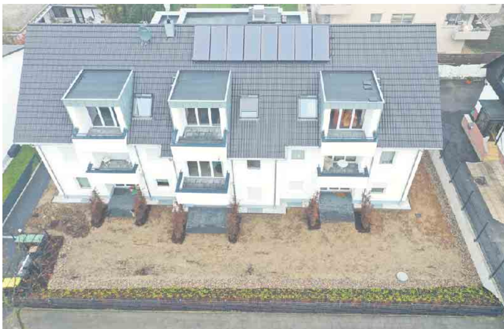
Das Dachdeckerhandwerk, der richtige Ansprechpartner für die Solaranlage auf dem Dach.