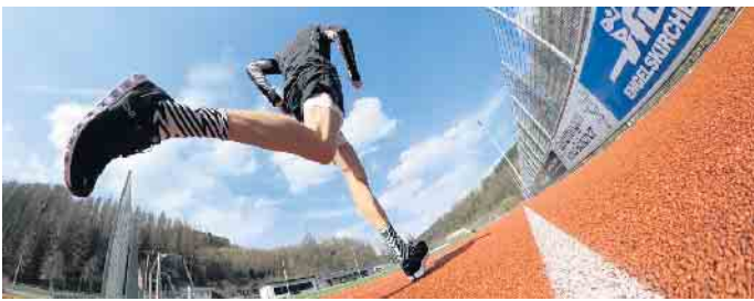
Sportabzeichen - ich komme.

Jahr wieder bei unseren erfahrenen Betreuern das Sportabzeichen ablegen. Dabei müsst Ihr in vier Disziplin-gruppen (Ausdauer, Kraft, Schnel-ligkeit und Koordination) Eure Fä-higkeiten unter Beweis stellen. Aber keine Angst, die alten Sport-abzeichenhasen wissen es, die Bedingungen sind gut zu schaf-fen. Mit ein bisschen Anstrengung kann es jeder schaffen. Ein Schwimmnachweis ist ebenfalls zu erbringen. Also, egal ob als Einzelperson, Gruppe, Familie oder im Team mit