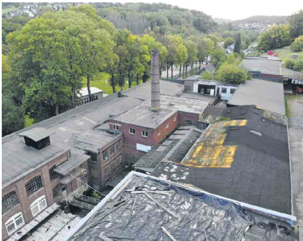
Gemeindeentwicklung oder nutzlose Ruine?