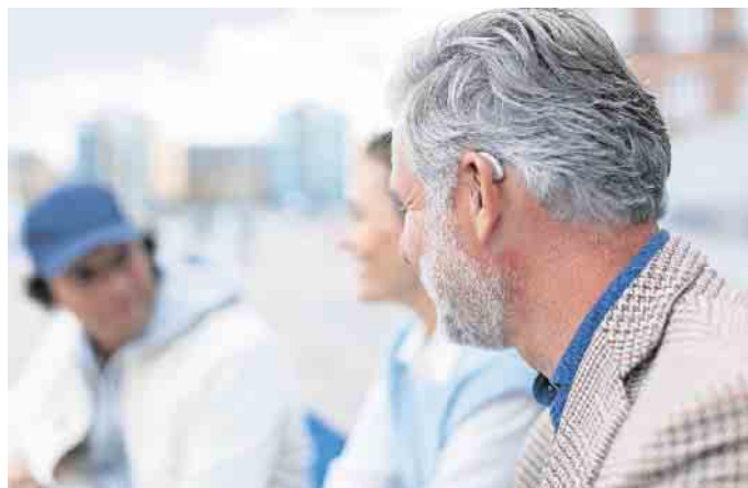
Wenn man Schwierigkeiten hat, einer Unterhaltung in geselliger Runde zu folgen, weist das auf Hörverlust hin.

Weit verbreitet ist zudem nach wie vor die Annahme, Hörsysteme ließen Menschen älter wirken - dabei ist das Gegenteil der Fall. Wer gut lauschen kann, ist entspannt und wirkt damit jünger als Menschen, die mit angestrengter Miene immer wieder „Wie bitte?“ fragen müssen. Und falsch ist auch die Befürchtung, das Tragen eines Hörgeräts würde den