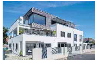
Mehrgenerationenhäuser in Holz-Fertigbauweise sind im Kommen.