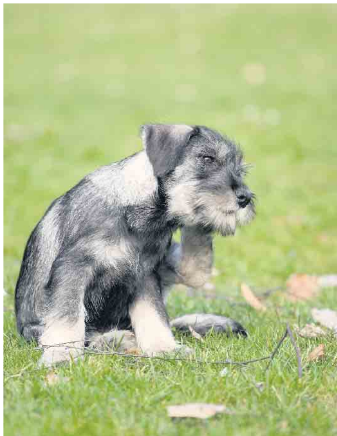
Gelegentliches Kratzen und Beißen ist bei Hunden normal. Nimmt es jedoch überhand, ist der Gang zur Tierarztpraxis gefragt.