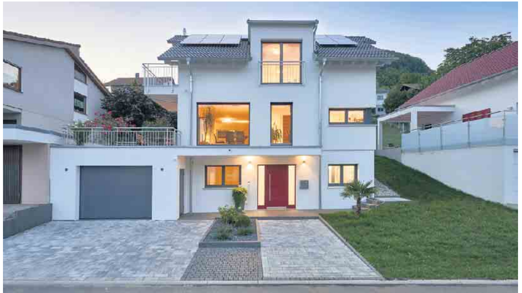
Eine separate Souterrainwohnung bietet zuhause mehr Flexibilität - auch für das Wohnen im Alter.

Wer sich dran gibt, ein Eigenheim zu bauen oder bauen zu lassen, kann mit überschaubarem Mehraufwand eine zweite Wohneinheit realisieren. Beliebt ist eine separate Einliegerwohnung im Souterrain. „Gerade auf Baugrundstücken in Hanglage schafft ein Kellergeschoss nicht nur ein sicheres Fundament für den Neubau sowie Nutzfläche etwa für die Haustechnik oder für eine Garage, sondern auch hochwertige Wohnfläche, die gerne für eine lichtdurchflutete, idealerweise barrierefreie Souterrainwohnung genutzt wird“, sagt Christian Kunz von der Gütegemeinschaft Fertiggeller (GÜF). Eine Einliegerwohnung im Keller? - „Da ist es doch dunkel, feucht und muffig. Da möchte ich bestimmt nicht wohnen“, wird sich früher manch einer gedacht haben. Heute ist das ganz anders, was nicht etwa daran liegt, dass man gerade in Ballungsgebieten jede Wohnung nehmen muss, die man kriegen und bezahlen kann. Nein, vielmehr ermöglichen auch Wohnungen im Kellergeschoss inzwischen echtes Wohlfühlwohnen. „In fast jedem Einfamilienhaus mit Keller wird dieser als vollwertiges Wohngeschoss mit modernen Lösungen für Frischluft und Tageslicht sowie mit effizienter Heizung und effektiver Wärmedämmung geplant“, so Kunz. Die entstehende Wohnfläche im Untergeschoss des Hauses kann zum Beispiel für eine Wellnessoase oder für ein Homeoffice selbst genutzt oder aber für eine separate Wohneinheit verwendet werden. Eine Einliegerwohnung dient