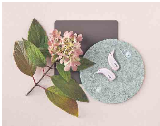
Um Musik richtig genießen zu können, ist ein feines Gehör eine wichtige Voraussetzung.

Typische Anzeichen sind etwa Schwierigkeiten, in einer lebhaften Gruppe der Unterhaltung zu folgen. Auch wenn der Lautstärkeregler von TV, Computer oder Musikanlange stetig lauter gedreht werden muss, ist das ein Indiz - dann sollte man zügig handeln. Unter www.oticon-more.de sind qualifizierte Hörakustiker in Wohnortnähe zu finden. In Deutschland leidet etwa jeder siebte Erwachsene unter Schwerhörigkeit, in der Altersgruppe ab dem 65. Lebensjahr sogar ungefähr jeder zweite, so der Deutsche Berufsverband der Hals-Nasen-Ohrenärzte. (djd)