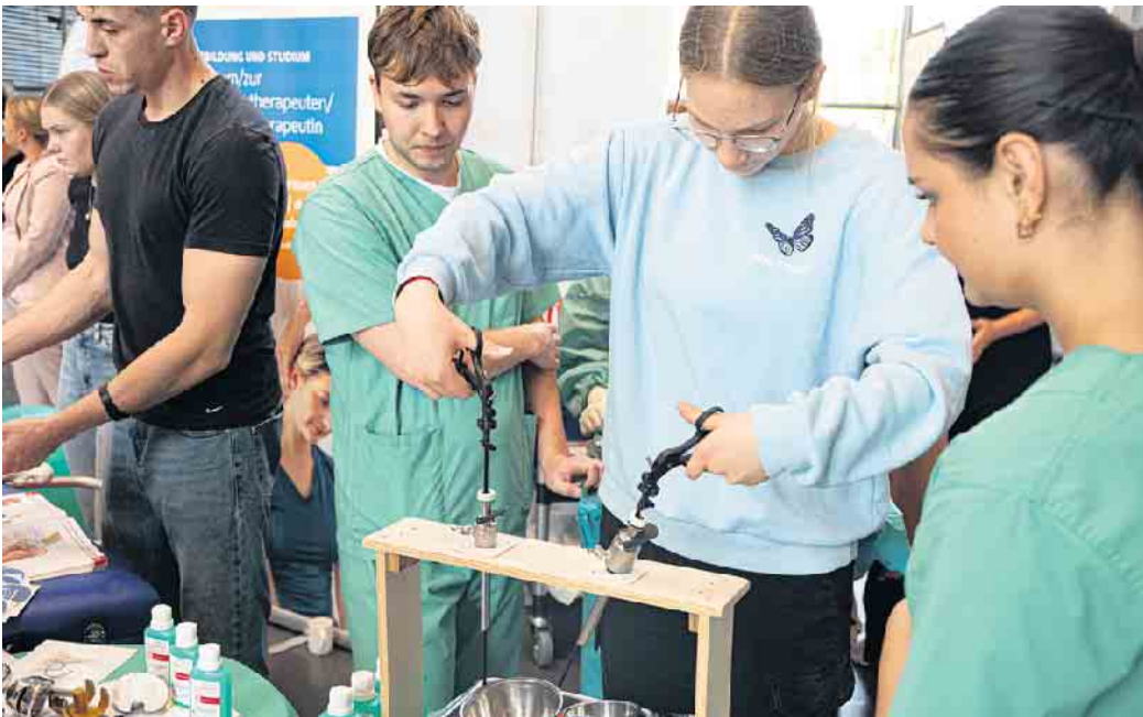
Über vielfältige Ausbildungs- und Arbeitsbereiche des GBZ und der AGewiS informiert der Oberbergische Kreis in einem Elternabend.

Schulen ab der achten Klasse sind herzlich eingeladen. Eine Anmeldung ist erforderlich