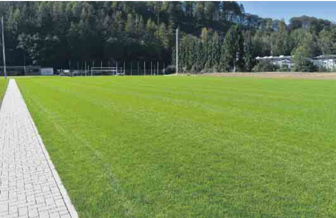
Sportanlage ASC Loope e. V.