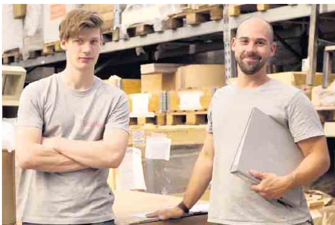
Viele Nachwuchskräfte kommen über ein Praktikum zu ihrem Beruf als Ofen- und Luftheizungsbauer.

Ofen- und Luftheizungsbauer als besonderer Beruf mit guten Zukunftschancen