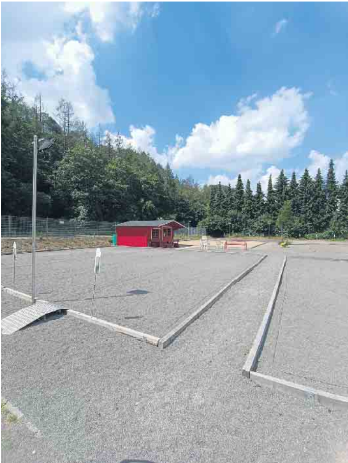
Bouleanlage ASC Loope e. V.