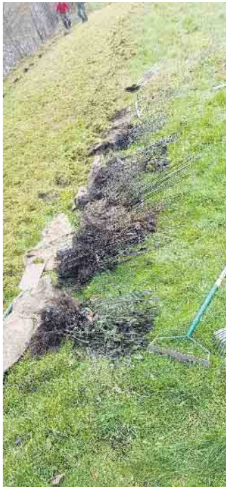
Auswahl an heimischen Heckenpflanzen

Rückbau der Verbauung beginnen. Sollten Sie selbst an einer natürlicheren Umgestaltung Ihres Gartens interessiert sein, kontaktieren sie uns gerne. Unser Grundstückseigentümer hat es vorge-macht, geben wir der Natur ein Stück zurück! Wir hoffen auf eine Vielzahl an Nachahmern!