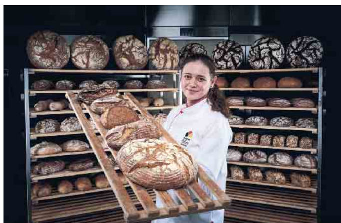
Junge Leute sind begehrt in der Branche - sie haben Spaß an Lebensmitteln, sind kreativ und holen sich ihre Inspirationen auch über soziale Medien.