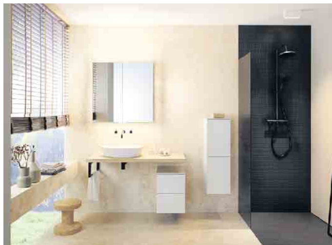
Mit den richtigen Möbeln werden Badezimmer dauerhaft sicher und komfortabel zum individuellen Wohlfühlort.

Nach einem ausgiebigen Dampfbad oder bei Wasserspritzern sei es zudem ratsam, Möbeloberflächen aktiv trocken zu wischen, sagt DGM-Geschäftsführer Jochen Winning. Rückstände von Zahnpasta oder Zerstäubern und erst recht von aggressiven Chemikalien wie Scheuermitteln oder Haartönung sollten ebenfalls besser früher als später von Möbeloberflächen entfernt werden.