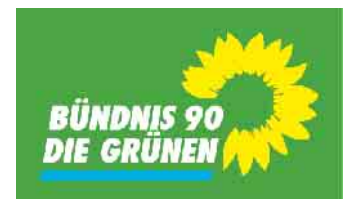
Bündnis 90 / Die Grünen

geschäfte wie zum Beispiel die Cum-Ex-Betrüge sind im Wahlkampf kein Thema, obwohl dem Fiskus dadurch jährlich schätzungsweise über 100