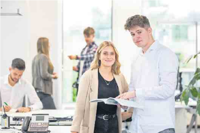
Vertriebstalente im Außendienst sind gefragt und die Entwicklungsperspektiven ausgezeichnet.

vielseitigen Berufsumfeld entfalten kann: „Von der Kundenberatung über die Angebotserstellung bis hin zum Verkauf werden wir in vollem Umfang in die Arbeitsabläufe einbezogen.“ Während der gesamten Ausbildung erfahren die angehenden Vertriebsprofis eine individuelle und praxisnahe Begleitung, was