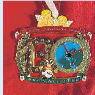
Orden der Gesellschaft