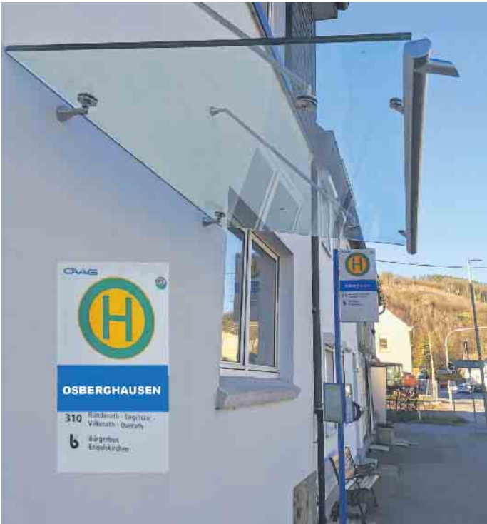
Unter dem Glasdach kann man jetzt im Trockenen auf den Bus warten.

der nicht vorhandenen Tiefe des Bürgersteigs, der gleichzeitigen Nutzung als Radweg oder den Zuständigkeiten in den Ämtern zu tun hatten. Meistens waren deren Mühlen langsamer als die Wahlperioden der Ehrenamtler, die darum bemüht hatten, die „Schul-Schäffchen“ ins Trockene zu bringen. So blieb es dabei, dass SchülerInnen jahrgangsweise