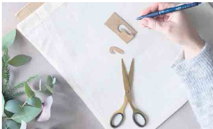
Mit einer Schablone werden alle Zuckerstangen gleich groß.