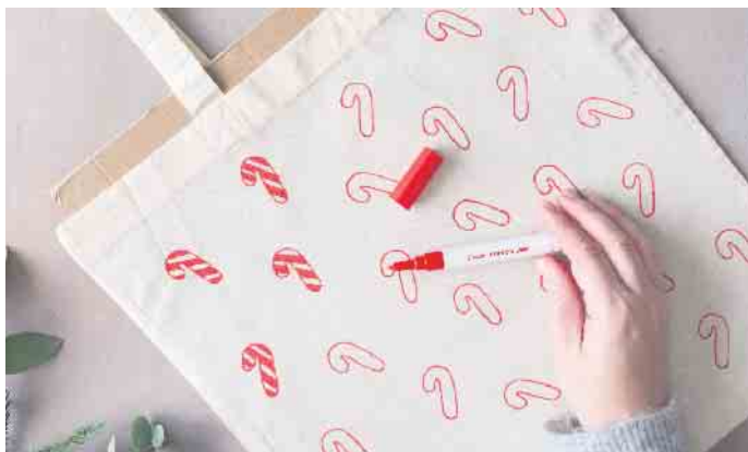
Eine Pappe im Beutel verhindert das Durchdrücken der Farbe.