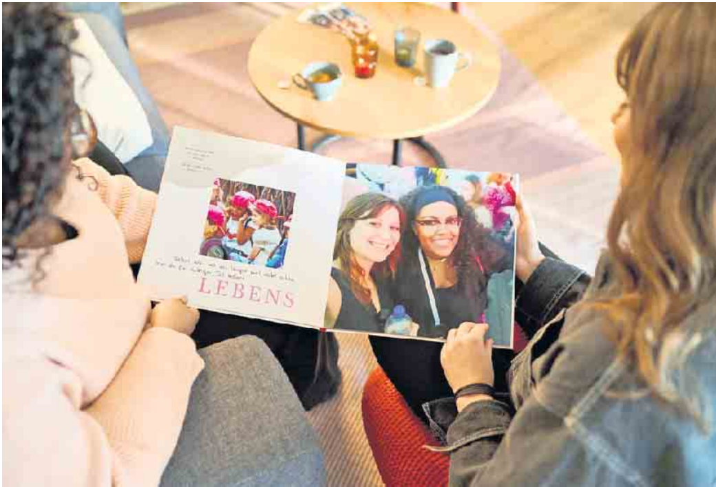
Schöne Erinnerungen verschenken: Ein Fotobuch hält Höhepunkte des Jahres auf kreative Weise fest.

So werden aus Fotos individuelle und emotionale Weihnachtspräsente