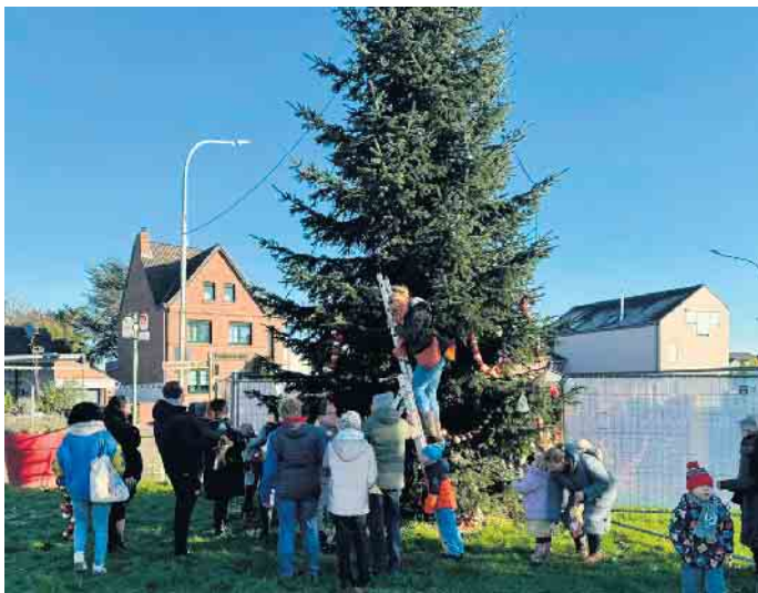
Baumschmücken in Angelsdorf

nen ging es dann für die Spielfreunde am 3. Adventswochenende auf dem Christkindlmarkt in Angelsdorf. Hier boten die Spielfreunde für alle Kinder eine Weihnachts-Bastel-Werkstatt an. Es konnten verschiedene weihnachtliche Anhänger - Schneeflocken, Sterntaler, Schneemänner, Lebkuchen, Sterne usw. - gebastelt werden. Zudem wurden eifrig Wunschzettel ans Christkind gemalt und geschrieben, die anschließend ans Christkind nach Engelskirchen geschickt wurden. Von dort wird jedes Kind noch vor Weihnachten persönlich Post erhalten. Zum Abschluss des Jahres werden die Spielfreunde nun noch Weihnachtskarten gestalten und verschicken, umso alle Angelsdorfer Bürger*innen mit einem persönlichen Gruß zu Weihnachten zu erfreuen.