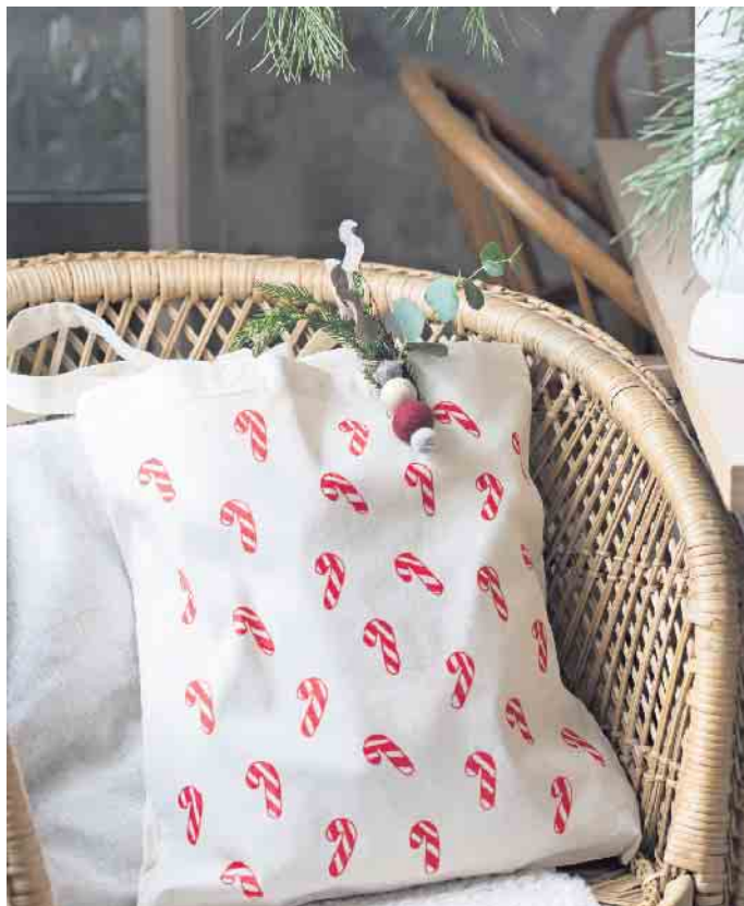
Weihnachtszauber im und auf dem Beutel.