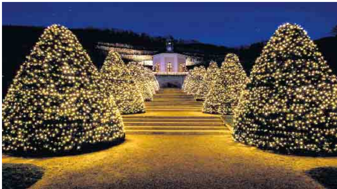
Lichterglanz in der kalten Jahreszeit: Schloss Wackerbarth lädt im Winter zu wärmenden Genussmomenten ein.

Rezept entdeckt hatten, passten sie es behutsam dem heutigen Geschmack an. Aus ausgesuchten Weißweinen, Traubensaft und feinwürzenden Zutaten kreierten sie ein feinfruchtiges Wintergetränk. Das Ergebnis heißt heute „Wackerbarths Weiß & Heiß“ und ist neben anderen erlesenen Spezialitäten unter shop.schloss-wackerbarth.de erhältlich. Auch vor Ort gibt es im Winter einen besonderen Genuss: Europas erstes Erlebnisweingut verwandelt seine Anlage und die Weinberge von November bis Februar in eine märchenhafte Welt aus Licht, Musik und Genuss. (DJD)