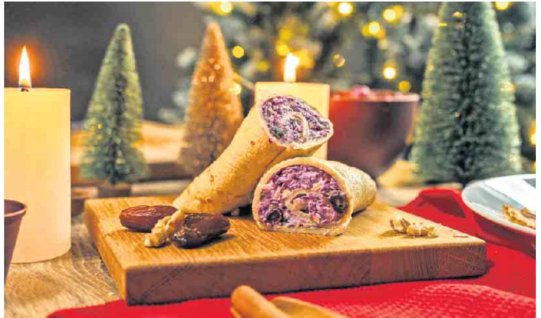
Gesund und lecker im Winter: Hafer-Wraps mit Rotkohl, Datteln und Walnüssen.

Unter www.hafer-die-alleskoerner.de finden sich neben Back- und vielen anderen süßen Rezepten auch Ideen für herz hafte Gerichte mit Haferflocken. So sind beispielsweise winterliche Hafer-Wraps mit Rotkohl, Datteln und Walnüssen eine vorzügliche Wahl. Sie sind innerhalb von etwa 30 Minuten leicht zuzubereiten, plus zwei Stunden Ruhezeit.