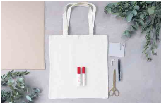
Für Jutebeutel mit Zuckerstangen braucht es nicht viel Material.

Mit ein bisschen Kreativität und den richtigen Stiften lassen Stoffbeutel sich ganz einfach zu individuellen Accessoires in stimmungsvoller Weihnachtsoptik verwandeln.