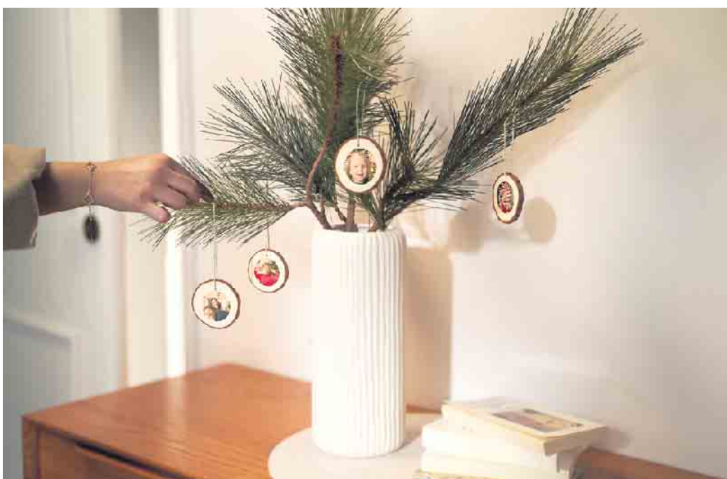
Einfach und schnell kreativ werden: Fotosticker lassen sich auf eine Holzscheibe kleben und mit einer Schnur an einem Tannenstrauß befestigen.

Bändern befestigt werden. Auch ein Kleiderbügel ist perfekt geeignet, um die Karten liebevoll zu präsentieren. Dazu einfach die Grußkarten mit Bändern und Klammern an dem Bügel befestigen und mit Tannenzweigen oder Schleifen verzieren. (DJD)