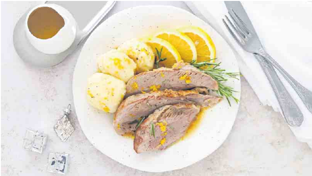
Wer sich mehr Zeit für die Familie und für genussvolle Momente wünscht, sollte an den Festtagen auf Geflügelgerichte setzen - beispielsweise die Putenunterkeule á l'orange.

in dem Bratfett anrösten. Mit Cointreau und Orangenstücken 5 Minuten köcheln lassen. Brühe angießen, Rosmarin dazugeben. Putenunterkeulen obenauf setzen und 1,5 Stunden garen. Knödel zubereiten. Soße durch ein Sieb geben, auffangen, mit der Orangenmarmelade aufkochen, kalte Butter unterrühren und mit Salz und Pfeffer abschmecken. Alles anrichten und genießen. (DJD)