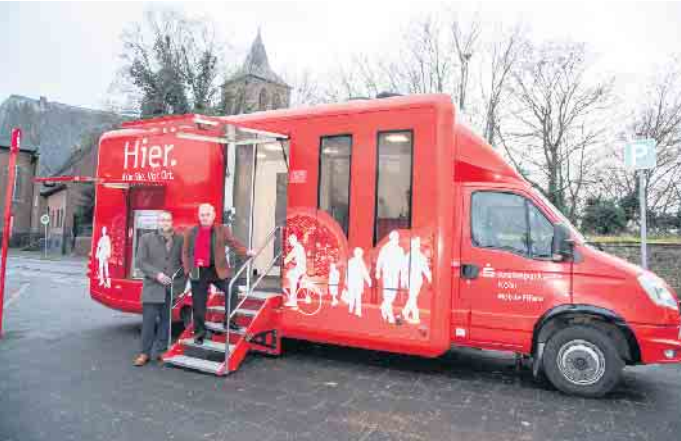
Auf der Galdbacher Straße zwischen der ehemaligen Gaststätte im Winkel und der Kirche findet man die mobile Filiale der KSK nun jeden Montag von 9.15 bis 10.15 Uhr

Sowohl in Esch als auch in Berrendorf gibt es seit Mitte des Jahres die Möglichkeit, in einer mobilen Filiale der Kreissparkasse Köln seine Geldgeschäfte zu tätigen.