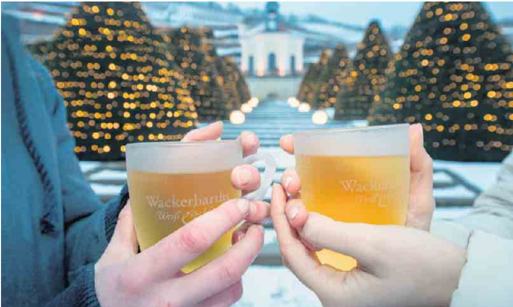
Ob weiß oder rot, in der kalten Jahreszeit sind wärmende Getränke gefragt.