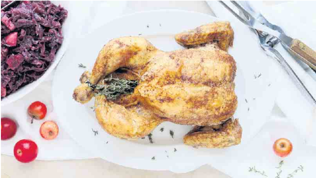
Festtagshähnchen mit Lebkuchen-Zimtmarinade: Dieses Rezept ist unkompliziert und sorgt für ein kulinarisches Highlight an Weihnachten.

Zubereitung: Lebkuchengewürz, Zimt, Muskat, Zucker, Öl, Saft der Orange und etwas Salz und Pfeffer mischen. Hähnchen rundherum