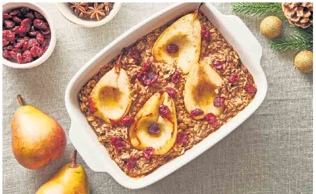
Haferflocken statt Nüsse machen das Baked Oatmeal für Allergiker verträglich.

kohlstrunk entfernen und Rotkohl in sehr dünne Streifen schneiden, waschen und durchkneten. Die Datteln fein würfeln und die Walnüsse hacken. Alle Zutaten mit dem Frischkäse mischen und mit Honig, Pfeffer und Salz abschmecken. Füllung auf die Wraps streichen, eng zusammenrollen und zwei Stunden kühl stellen. (DJD)