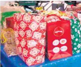
Weihnachtstütenaktion der Tafel Elsdorf

Das Team der Tafel Elsdorf bedankt sich ganz herzlich, auch im Namen unserer Kunden, bei allen, die uns in diesem Jahr mit Weihnachtstüten sowie zahlreichen Geldspenden unterstützt haben. Ihr Team der Tafel Elsdorf