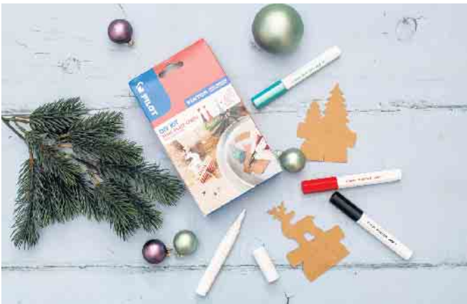
Praktisch in der hektischen Adventszeit: Ein Bastelset mit vorgefertigten Kärtchen und Stiften in weihnachtlichen Farben.

Besonders praktisch: Auch Geschenke zu Geburtstagen, Hochzeiten und anderen Gelegenheiten lassen sich einfach mit einem passenden Tuch verpacken und mit individuell gestalteten Kärtchen personalisieren. Wer das PINTOR DIY-Set Xmas Tischkarten von Pilot hat, kann mit den darin enthaltenen Markern weitere Grußkarten beschriften oder sie für andere Bastelprojekte nutzen. Denn ganz im Sinne der Nachhaltigkeit halten die Marker auch auf Materialien wie Holz, Metall und Kunststoff, sodass sie auch für viele andere Bastelprojekte außerhalb der Weihnachtszeit verwendet werden können. (DJD)