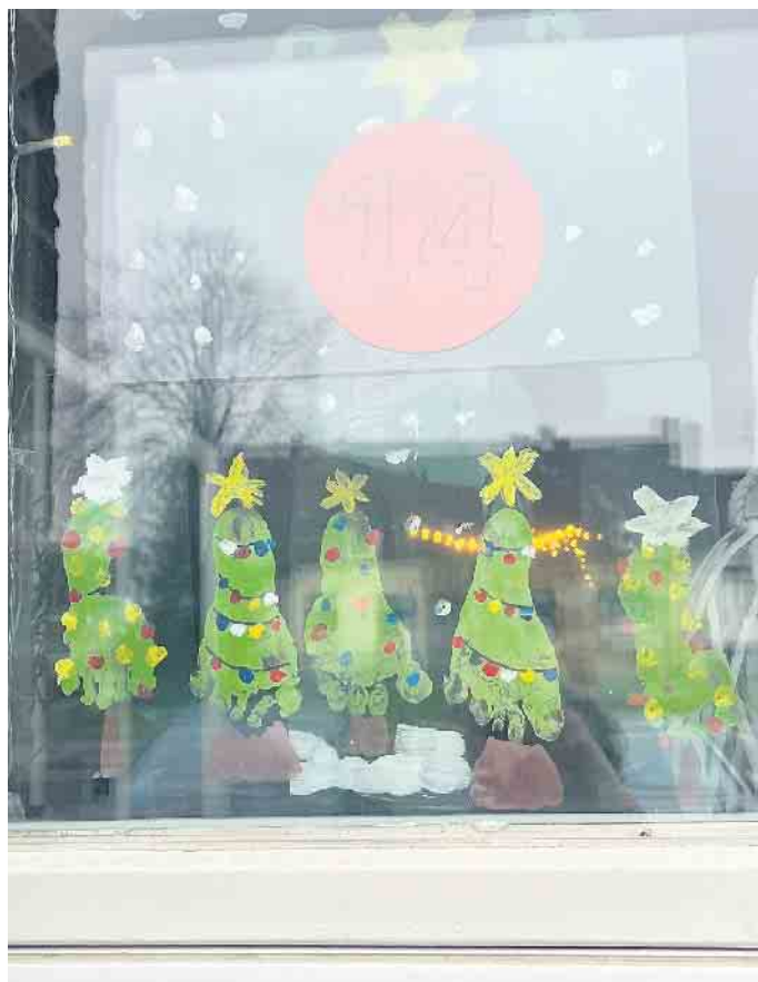
„Tannenbaum-Füßchen“ schmückten das Adventsfenster ebenfalls

Zuschauern enthüllt. Bei Gebäck und Punsch fand ein geselliges, vorweihnachtliches Beisammensein statt. Das Adventsfenster war von dem Team der „Frühen Hilfen“ mit tatkräftiger Unterstützung von Müttern und Kindern aus der Spiel- und Krabbelgruppe geschmückt worden.