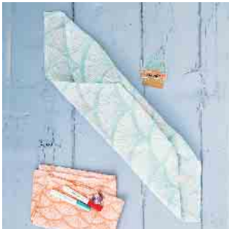
Schritt 3: Die Kanten noch ein weiteres Mal umlegen, sodass der Stoff eine längliche Form einnimmt.