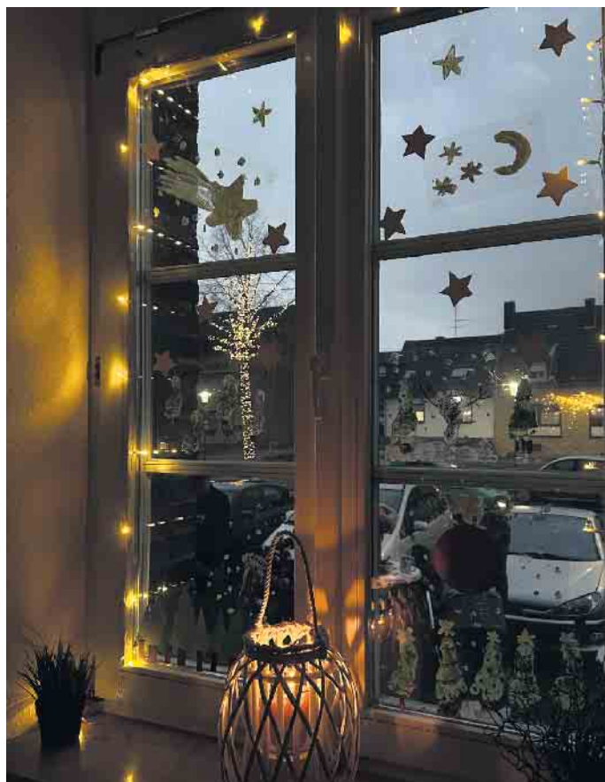
Das Adventsfenster im BPZ in Giesendorf ist weihnachtlich geschmückt

Auch Beratungs- und Präventionszentrum nahm teil