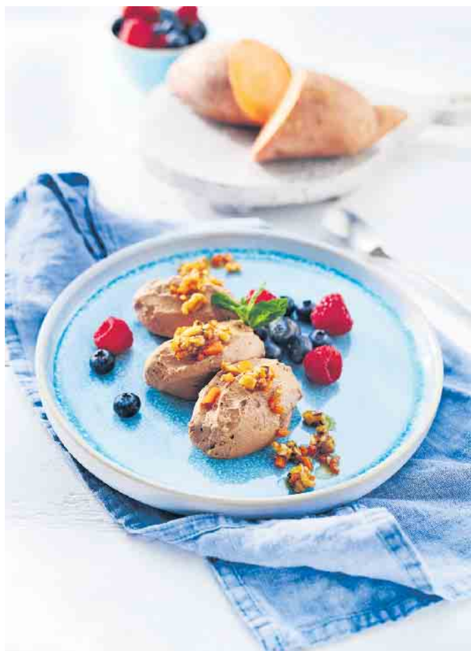
Süßkartoffel-Schoko-Mousse als leckeren Nachtisch.