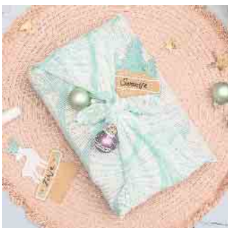
Schritt 4: Beide Enden miteinander verknöten und voilà!