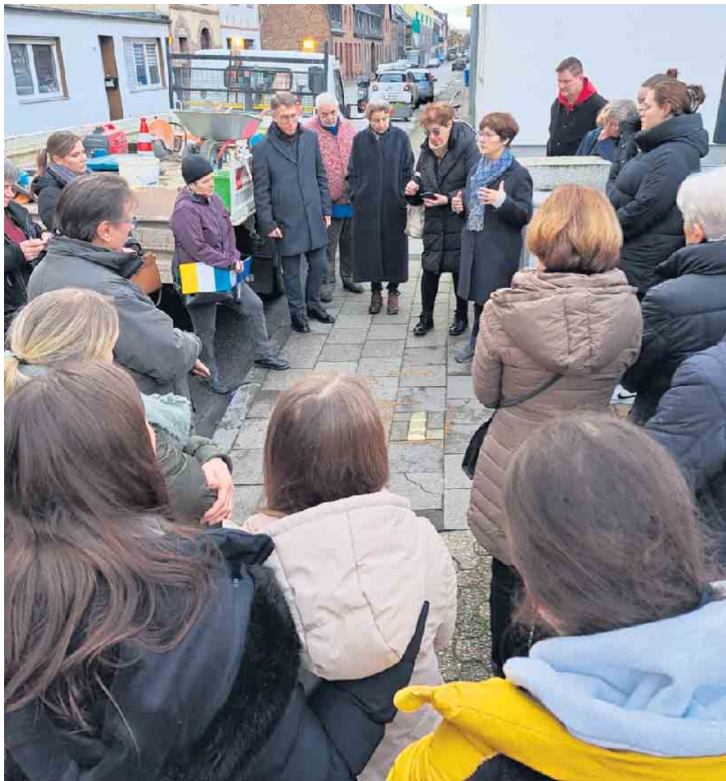
Vier der insgesamt 20 neuen Stolpersteine in Elsdorf

Die Stolpersteine wurden unter großer Beteiligung der Bevölkerung vom Künstler und Initiator der Stolpersteine, Gunter Demnig, und dem Bauhof der Stadt Elsdorf verlegt. Die Kulturabteilung der