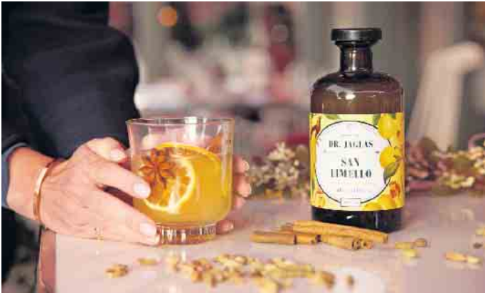
Der „Hot Limello“ schmeckt, tut gut in der kalten Jahreszeit und ist alkoholfrei.

verzichten, kann das neue Jahr mit einem guten Vorsatz beginnen und dem Körper ein paar entlastende Detox-Wochen gönnen. Im Trend liegt etwa der „Dry January“: Die Teilnehmer dieser Challenge verpflichten sich, einen Monat lang keinen Alkohol zu trinken. Trotz „Alkoholbremse“ oder „Alkoholpause“ muss niemand auf einen leckeren Drink verzichten Wer auf die Alkoholbremse treten oder eine Alkoholpause einlegen möchte, hat bei alkoholfreien Alternativen zu beliebten alkoholischen Getränken heute die Qual der Wahl. Den angesagten Zitronenlikör Limoncello etwa gibt es auch in alkoholfreien Varianten, zum Beispiel als San Limello vom Berliner Apotheken-Label „Dr. Jaglas“. Er schmeckt sowohl im