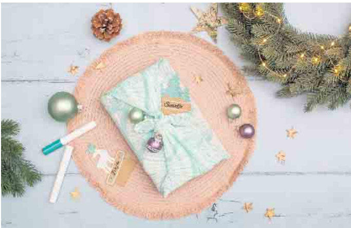
Mit der Furoshiki-Methode lassen sich Geschenke umweltfreundlich einpacken.

Individuelle und umweltfreundliche Verpackungen einfach basteln