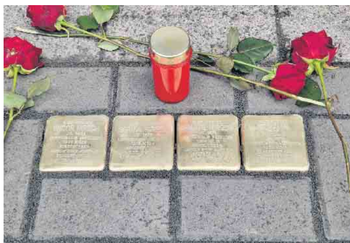
Unter großer Teilnahme der Bevölkerung wurden die Stolpersteine verlegt.

Tipp: Im Rathaus der Stadt Elsdorf ist eine Informationsbroschüre über alle im Stadtgebiet Elsdorf verlegten Stolpersteine erhältlich.