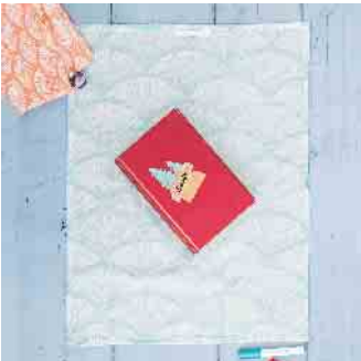
Schritt 1: Stofftuch parallel zur Tischkante ausbreiten und Geschenk in der Mitte platzieren.