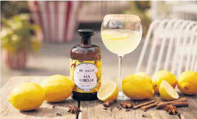
Den angesagten Zitronenlikör Limoncello gibt es auch in alkoholfreien Varianten, zum Beispiel als „San Limello“. In einem Cocktail wie einem Spritz erinnert er dank seiner Zitrusnote mitten im Winter an einen Urlaub in Italien.

Rezepttipps: Drei alkoholfreie Winterdrinks für festliche Anlässe