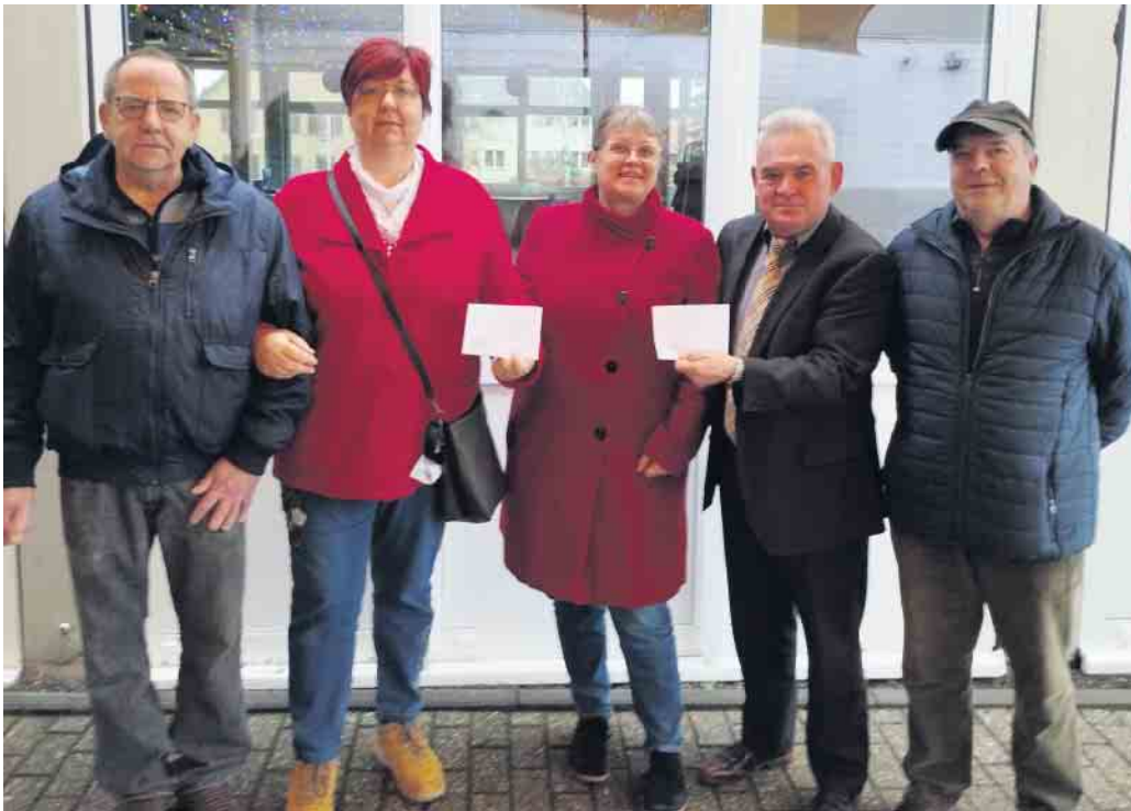
GGG Erich-Kästner-Schule Esch

Auf dem Nikolausmarkt haben wir angekündigt, dass ein Teil unserer Einnahmen wie in den vergangenen Jahren an die Erich-Kästner-Schule als auch an den Kindergarten Sternschnuppe in Esch gespendet wird.