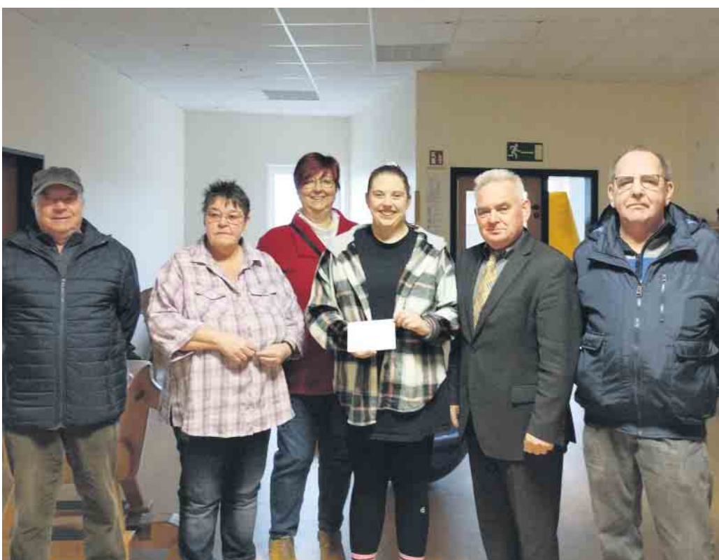
Kiga „Sternschnuppe“ Esch

Über Eure Zusagen an unserem Karnevalszug haben wir uns sehr gefreut. Dorfgemeinschaft Esch e.V.