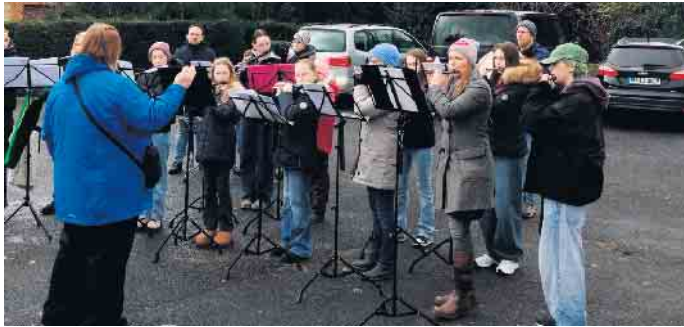
Auftritt der Spielfreunde

den letzten Wochen eifrig Girlanden und anderen Baumschmuck gebastelt. Dieser wurde mit Unterstützung von Erzieherinnen, Eltern und Vereinsmitgliedern zum Aufhängen vorbereitet und aufgehängt. Highlight war jedoch die tatkräftige Hilfe der Feuerwehr