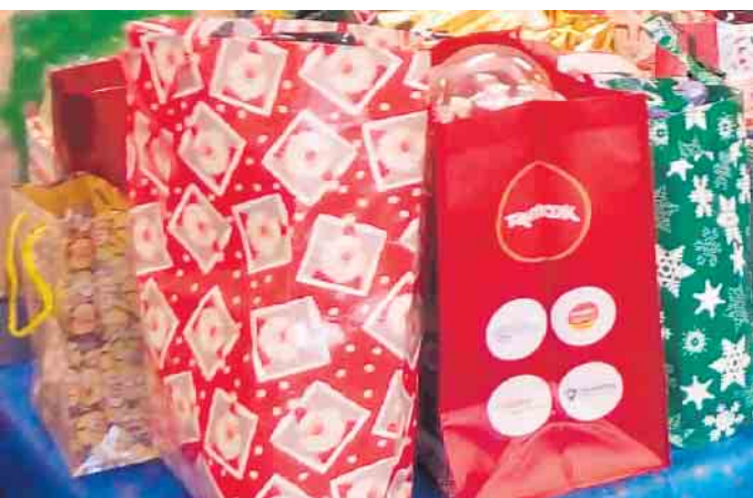
Weihnachtstüten Tafel Elsdorf

Weihnachtstütenausgabe: Dienstag, 16. Dezember von 10 bis 16 Uhr in der Eulenschule in Berrendorf, Heinrich-Doll-Str. 2 Die berechtigten Personen müssen bei der Tafel Elsdorf registriert sein!