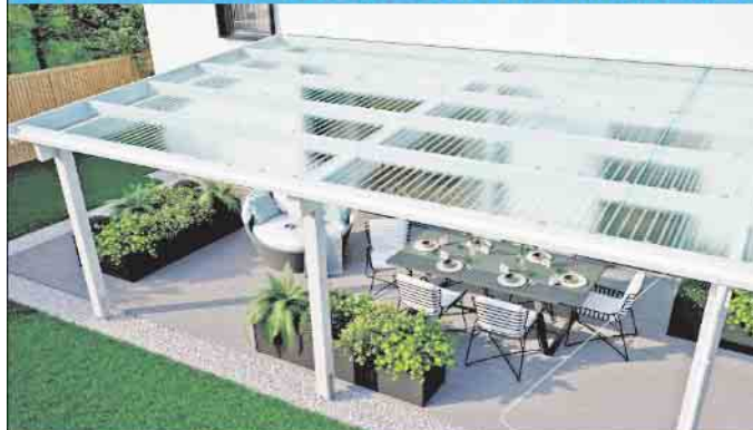
LICHTPLATTEN AUS PC + PMMA + PVC