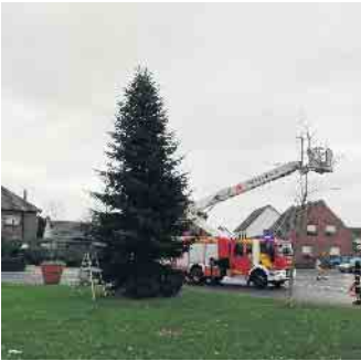
Vorbereitungen der Feuerwehr

Pünktlich zu Beginn der Adventszeit wurde am 30. November zum vierten mal in Folge der Tannenbaum auf dem Dorfplatz in Angelsdorf geschmückt. Kinder der Kita Kinderland und der Vereine - Spielfreunde Angelsdorf und Schützen Angelsdorf - hatten in