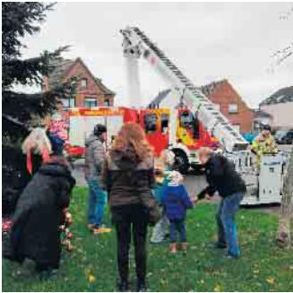
Das Schmücken beginnt

Pünktlich zu Beginn der Adventszeit wurde am 30. November zum vierten mal in Folge der Tannenbaum auf dem Dorfplatz in Angelsdorf geschmückt. Kinder der Kita Kinderland und der Vereine - Spielfreunde Angelsdorf und Schützen Angelsdorf - hatten in