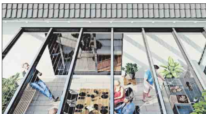
STEGPLATTEN FÜR TERRASSENDÄCHER UND WINTERGÄRTEN