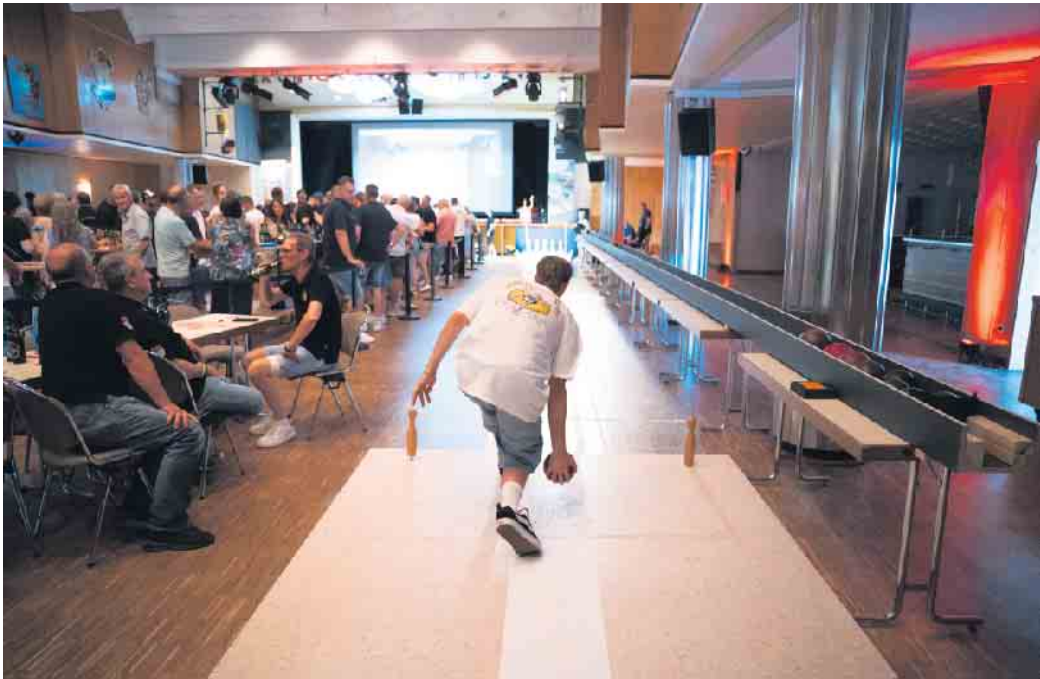
Der KC „voll dropp“ wurde Sieger der 1. Elsdorfer Kegelmeisterschaft.

in diesem Jahr sorgte mit 28 angemeldeten Clubs für spannende und gesellige Stunden auf den Kegelbahnen. Nach vorheriger, öffentlicher Auslosung treten die Kegelclubs in 2026 zunächst in einer Gruppenphase (mindestens drei garantierte Spiele bei 32 Mannschaften) und anschließend im K.O.-System gegeneinander an, um den besten Kegelclub im Stadtgebiet zu ermitteln. Die Kegelmeisterschaft erstreckt sich über knapp neun Monate, in denen die Clubs gegeneinander um den Finaleinzug kämpfen. Ab dem 18. Februar startet die Gruppenphase. Abhängig von der Anzahl der teilnehmenden Kegelclubs (maximal 32) wird voraussichtlich in Vierergruppen gespielt, so dass man bis zum 12. Juli drei Spiele nach gemeinsamer Terminvereinbarung mit dem Gegner bestreitet. Danach folgt bis Ende Oktober die mit dem Achtfinale beginnende K.O.-Phase. An einem großen, gemeinsamen Final-Spieltag am 7. November soll bei kühlen Getränken und ausgelassener Stimmung vor Publikum der Sieger ermittelt werden. Die Festhalle Elsdorf wird zur Partyeile mit DJ und einer mobilen Kegelbahn im Originalmaß.