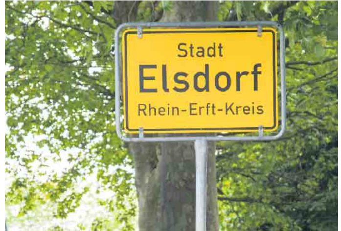
Mehrere Ortseingangsschilder wurden in verschiedenen Ortsteilen gestohlen.

der Täter(s) führen aus. Gleiches gilt für einige Vandalismus-Vorfälle an der neuen Bushaltestelle in Oberembt. An dem neuen Unterstand wurden Seitenwände beklebt, beschmiert und beschädigt sowie Folien abgerissen. Auch in diesem Fall bietet die Stadt Elsdorf eine Belohnung in Höhe von 500 Euro für sachdienliche Hinweise, die zur Feststellung des/der Täter(s) führen. Zeugen können sich an die Stadt wenden. Hinweise nimmt das städtische Bürgerbüro per E-Mail oder telefonisch (buergerbuero@elsdorf.de oder 02274 709 100) entgegen.