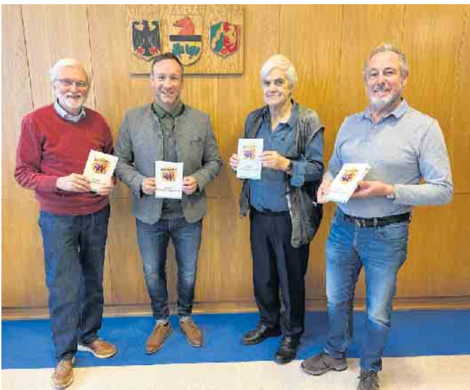
Vertreter des Seniorenbeirats und Bürgermeister Heller stellen den Seniorenwegweiser vor.

pair-Café des Seniorenbeirats. Im Repair-Café, das jeweils am zweiten Freitag des Monats von 14 bis 17 Uhr im Josefsheim stattfindet, kümmern sich Ehrenamtler um die Reparatur von Technik, kleinen Möbeln oder Ähnlichem. Wer Hilfe im Garten oder beim Einkaufen braucht, der kann Kontakte über die Taschengeldbörse knüpfen. Jugendliche bieten auf der Taschengeldbörse ihre Unterstützung für kleines Geld an. Auch die Freizeitgestaltung kommt im Seniorenwegweiser nicht zu kurz. Sowohl Ansprechpartner für Seniorenreisen als auch sportliche Angebote sind in der Broschüre aufgelistet. Ein sportlicher Höhepunkt aus Sicht des Seniorenbeirats: Gelenkschonender Fußball im Gehen. Eine Mischung aus Entspannung, Sport und Ausflug sind die Radtouren in und um Elsdorf. Die Touren dauern zwei bis drei Stunden, am Ende gibt es eine Einkehr. Wem Radfahren und Fußball nicht reichen, der findet auch Telefonnummern der ASG Elsdorf - und kann sich unter anderem für Gymnastikkurse, Reha-Sport oder Yoga anmelden. „Die ältere Generation hat viel dafür getan, dass Elsdorf ein lebenswerter Ort ist. Das kann ich gar nicht genug betonen“, sagt Bürgermeister Andreas Heller. „Deshalb freue ich mich umso mehr, dass wir mit dem Seniorenbeirat eine Interessenvertretung haben, die unsere Seniorinnen und