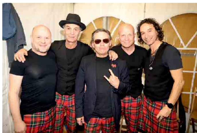
Die Band Brings sang mit dem Publikum zusammen ihren neuen Sessions-Hit, aber auch Klassiker und Evergreens hatten die Kölschrocker mit im Gepäck