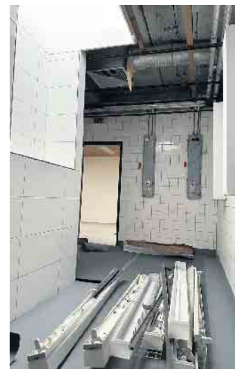
Die Umkleiden und Duschen aus dem Jahr 1980 werden derzeit umfassend erneuert.

Gleich an den ersten beiden Januar-Wochenenden kehrt dann wieder viel Trubel in die große Halle ein, wenn bei den Fußball-Jugendturnieren von GW Etzweiler bzw. SC 08 Elsdorf wieder Tore bejubelt werden können.