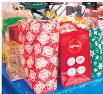
Weihnachtstaschenaktion Tafel Elsdorf

Annahme Montag, 16. Dezember, Eulenschule Berrendorf, Heinrich-Doll-Str. 2