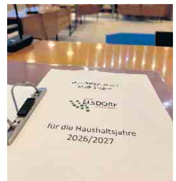
Der Doppelhaushalt 2026/2027 sieht wichtige Investitionen in den Bereichen Infrastruktur, Stadtentwicklung, Schulen, Kitas, Spiel- und Sportstätten und Freibad vor.