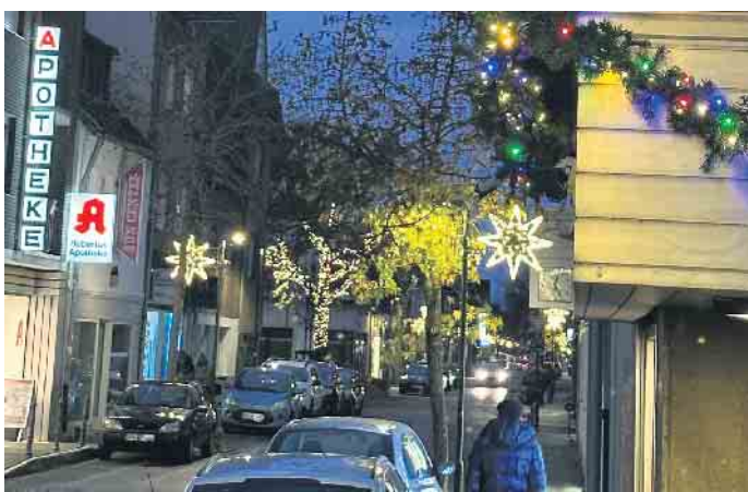
An der Köln-Aachener Straße sorgen leuchtende Weihnachtssterne für einen schönen Anblick.