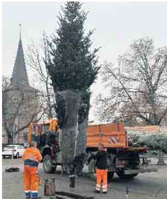
Mitarbeiter des städtischen Bauhofes haben die große Weihnachtstanne auf dem Berrendorfer Dorfplatz mit schwerem Gerät aufgestellt.

für die tolle Überraschung bei den kleinen Elsdorfern. Außerdem strahlen in der Stadtmitte im Einzelhandels- und Gastronomiebereich 26 Weihnachtssterne an den Straßenlaternen von der Köln-Aachener Straße über die Mittelstraße bis zur Gladbacher Straße. Vom Fahrradfachgeschäft bis zum Sportartikelhändler sorgen die leuchtenden Sterne für einen schönen Anblick - ergänzt um den illuminierten Baum am Kreisverkehr vor der Gelateria Cucco.