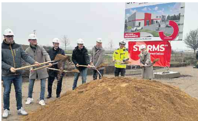
Vertreter von SAM Motion, des Bauunternehmens und der Stadt Elsdorf setzten zum symbolischen Spatenstich an, bevor in der nächsten Woche schon die ersten Hochbauarbeiten sichtbar sein werden.

GmbH“. Sie ist Bestandteil eines Firmenverbundes von drei Unternehmen, die insgesamt 34 festangestellte und ca. 24 freiberufliche Mitarbeiter/innen an verschiedenen Standorten beschäftigen. Jährlich werden von dem 2017 gegründeten Betrieb 5.000 - 7.000 Teilnehmende geschult. Ein Branchenschwerpunkt liegt in der Automobilindustrie mit der Qualifizierung von Inhabern, Verkäufern und Serviceberatern. Dabei gehören Automobilhersteller und -importeure wie Renault, Dacia, Toyota, Volvo, Nissan und Audi zu den Kunden. Einen großen Anteil