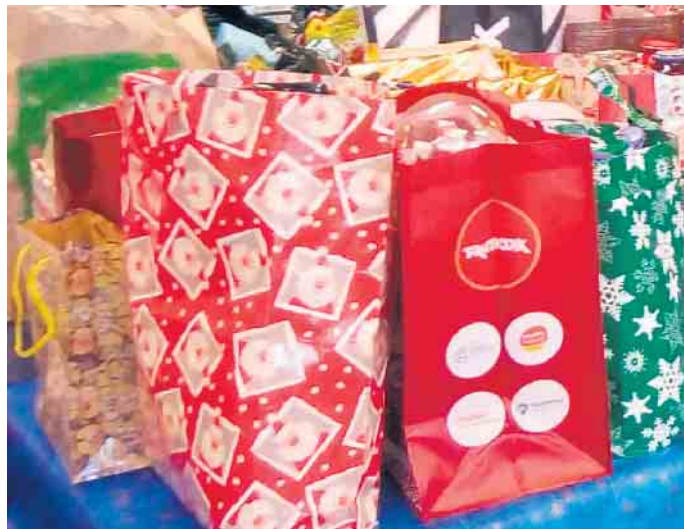
Aktion aus dem Vorjahr

(zu dieser Zeit sind wir erreichbar unter 0178 2330963)