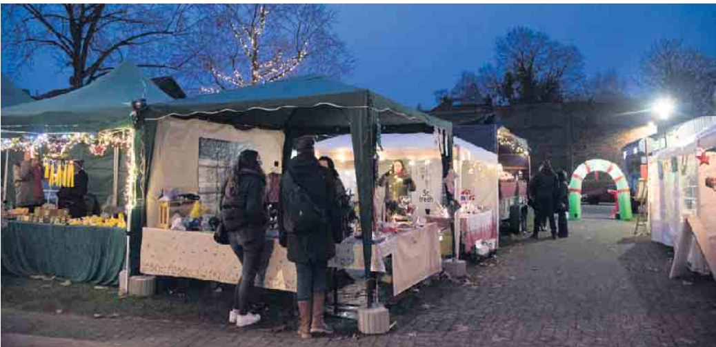
Kerzen, Kunsthandwerk und warme und kalte Köstlichkeiten sind in Oberembt wieder im Angebot.