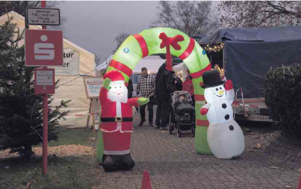
Schneemann und Nikolaus wiesen 2022 den Weg auf den Oberembter Weihnachtsmarkt