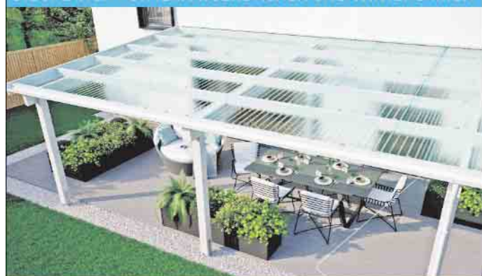
LICHTPLATTEN AUS PC + PMMA + PVC

HOLZFACHHANDEL Mathar u. Wetzel & Co. GMBH