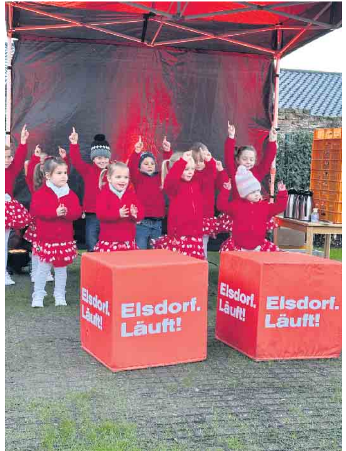
Die KG-Tanzgruppe „Minimäuse“ eröffneten mit einem tollen Auftritt das Fest.