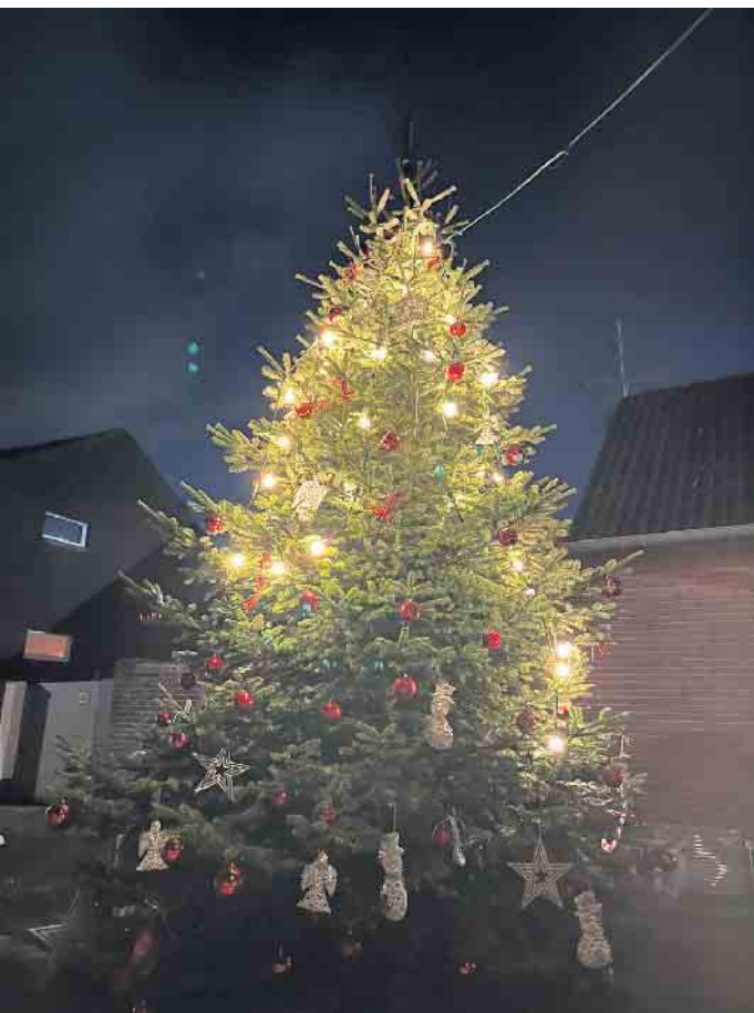
So wird er wieder aussehen!

Euer Bürgerverein Tollhausen, Freiwillige Feuerwehr Tollhausen, Reiterfreunde Tollhausen