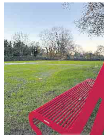
Die Fläche bietet nun auch Platz für das große Festzelt, das für den Weihnachtsmarkt und die Karnevalsveranstaltungen aufgebaut wird.

schutz erhielt die Stadt Elsdorf Fördergelder über 233.000 Euro, so dass 85% der Kosten vom Land übernommen wurden.