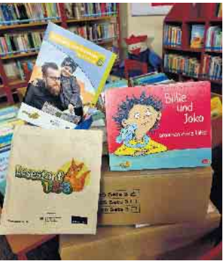
Die neuen Lesestart-Sets stehen - solange der Vorrat reicht - in der Stadtbibliothek bereit.

Zusätzlich können online unter www.lesestart.de nützliche Tipps rund ums Vorlesen in vielen Sprachen, Bastelvorschläge und Vorlese-Buchtipps kostenlos heruntergeladen werden.