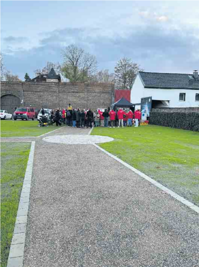
Viele Gäste kamen zur feierlichen Wiedereröffnung des Josef-Müller-Platzes, der nun als neuer Dorfplatz mitten in Oberembt genutzt werden kann.

Josef-Müller-Platz nach umfangreichem Umbau wiedereröffnet