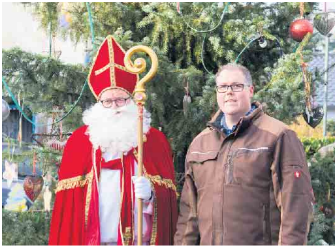
Nikolaus und Ortsvorsteher laden zum Weihnachtsmarkt in Oberembt ein

am Sonntag, 4. Dezember von 11 bis 20 Uhr. „Wir freuen uns auf Ihren Besuch!“ Ab 15 Uhr am Samstag und am Sonntag wird der Nikolaus den Markt besuchen und die Kinder beschenken. Am 6. Dezember wird der Orts- vorsteher mit den Kindergarten- kindern wieder den Weihnachts- baum auf dem Dorfplatz schmü- cken. (mos)