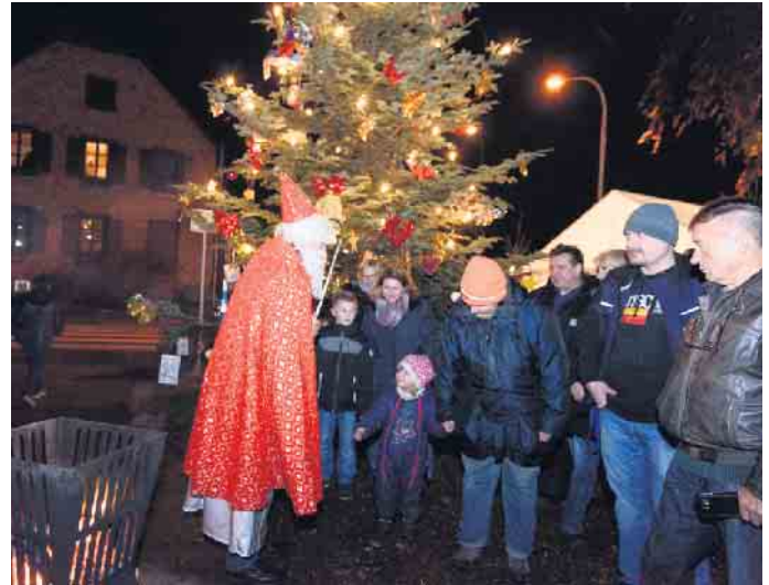
Vor der prächtig geschmückten Tanne wird der Nikolaus persönlich wieder die Kinder belohnen