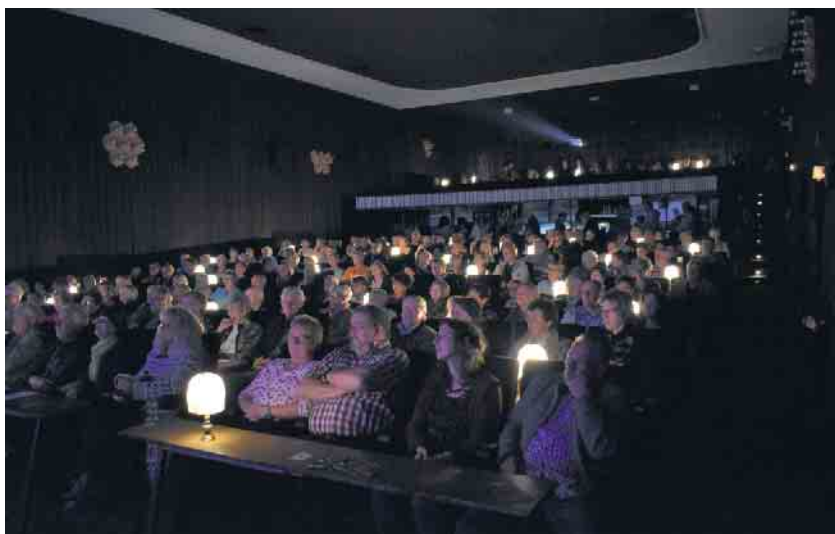
Am 29. November läuft der James-Bond-Kultfilm „007 jagt Dr. No“ im Elsdorfer Kino.

Backstübchen (Heppendorf). Karten an der Abendkasse kosten 9 Euro.