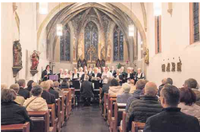
Im festlichen Ambiente der kleinen Angeldorf Kirche präsentierten sich zwei Chöre aus Elsdorf und Angeldorf