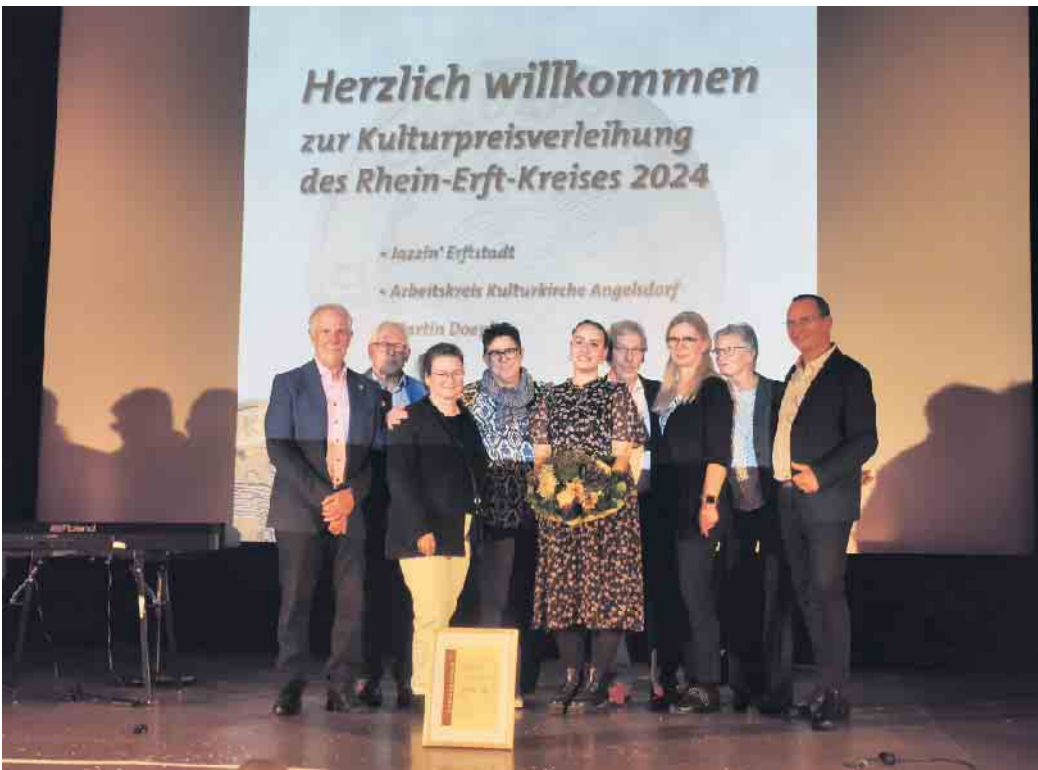
Im Kerpener Capitol nahmen die Vertreter der Kulturkirche den Preis entgegen.

Dementsprechend groß ist das Angebot der Kulturkirche. Jährlich bietet der Verein sechs bis sieben Veranstaltungen an. Neben Konzerten und Lesungen gibt es Mitsingabende oder Besuche von Karnevalsgrößen. Nicht selten stehen auch rheinische Traditionen und Brauchtum im Vordergrund. Das eigene Jubiläum hat