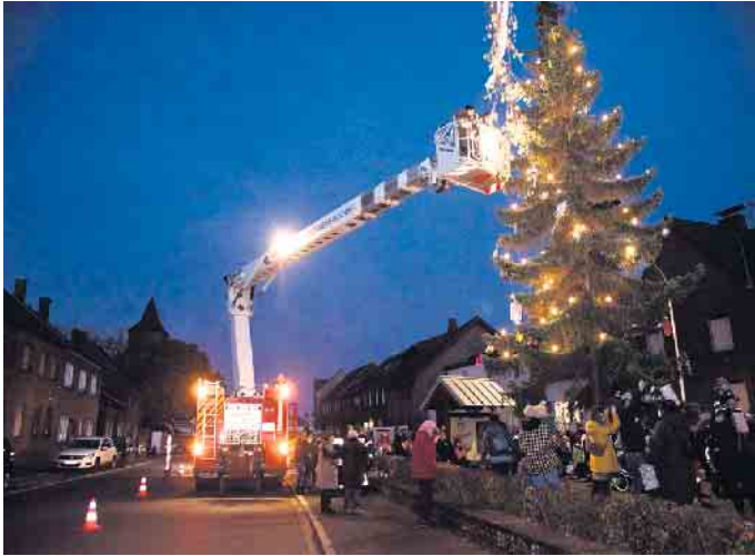
Mit dem Multistar der Feuerwehr wird beim Nikolausmarkt in Esch der Tannenbaum geschmückt