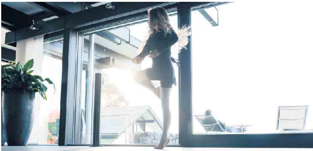
Ruhe genießen: Spezielle Schallschutzgläser halten den Alltagslärm draußen und verbessern so die Wohnqualität.

Gerade in älteren Gebäuden, bei denen sich die Fassadendämmung und die Fenster nicht auf dem heutigen Stand der Technik befinden, kann die Lärmbelastung im Inneren besonders hoch sein. Eine Modernisierung dient in diesem Fall dazu, gleich zwei Fliegen mit einer Klappe zu schlagen: Ein besserer Wärmeschutz oder der Einbau neuer Fenster führt nicht nur zu weniger Wärmeverlusten und geringeren Heizkosten, sondern kann gleichzeitig dem Schallschutz dienen. „Einzelscheiben außen und innen in unterschiedlicher Stärke stellen die einfachste Art eines Schallschutzes dar. Durch das jeweilige Schwingungsverhalten lassen sich bereits sehr gute Schalldämmwerte errei-