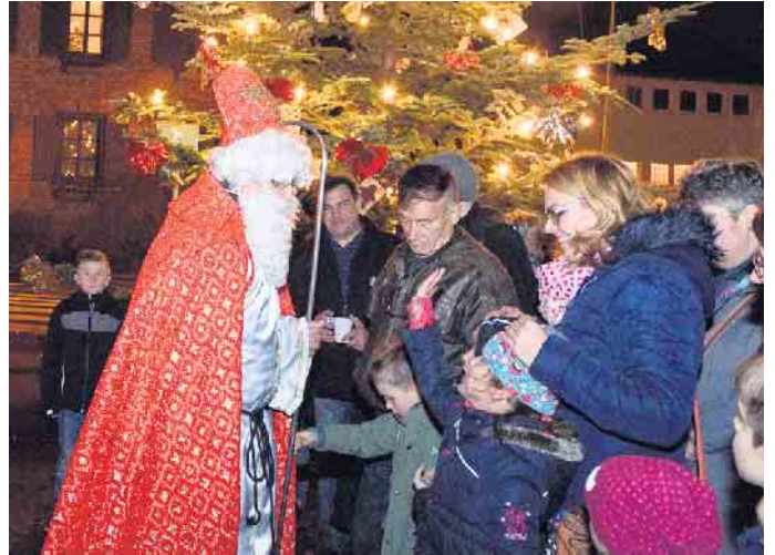
Am prächtig geschmückten Weihnachtsbaum wird der Nikolaus die Kinder belohnen

alljährlichen Nikolausmarkt ein. Ab ab 16 Uhr trifft man sich auf dem Platz an der Grundschule. Alle Kinder sind anschließend eingeladen, ihren selbstgebastelten Schmuck mit Hilfe des Multistars der Feuerwehr an die Zweige der