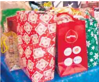
Weihnachtstaschenaktion Tafel Elsdorf

Annahme Montag 16. Dezember Eulenschule Berrendorf, Heinrich-Doll-Str. 2