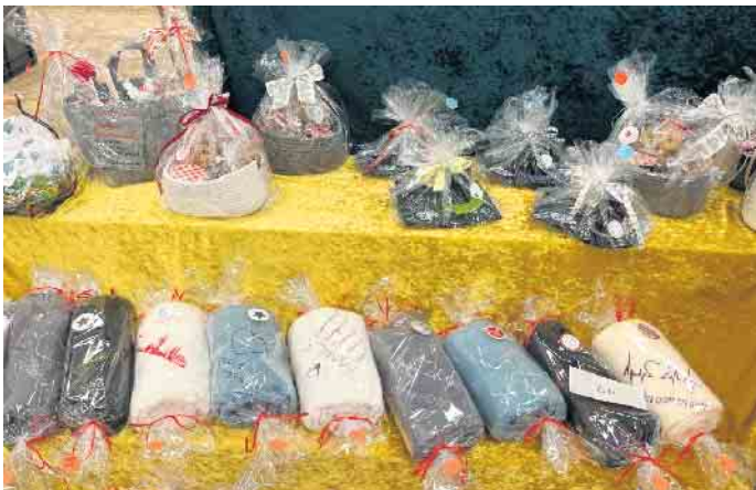
hübsche Decken und Präsentkörbe