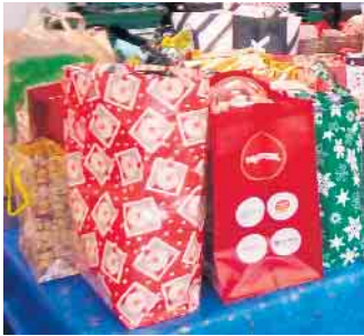
ein Ausschnitt aus dem Jahr 2022

Annahme 18. Dezember, Eulenschule Berrendorf, Heinrich-Doll-Str. 2