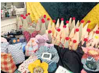
Dom in Holz und Beton noch erhältlich

Am 4. und 5. November öffneten wir im „Berrendorfer Treff“ unser Pforten und was soll ich sagen, wir waren überwältigt von den zahlreichen Besuchern. Wir sagen allen und ganz bewußt an erster Stelle, unseren tollen ehrenamtlichen Helfenden, vielen Dank für Euren Einsatz und tolle Unterstüt-