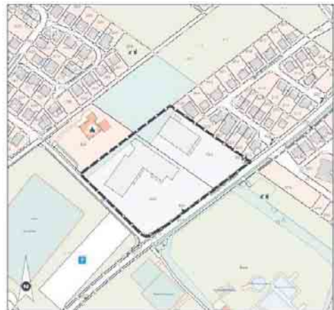
Abbildung: Geltungsbereich der 11. Flächennutzungsplanänderung

Am 28.03.2023 hat der Rat der Stadt Elsdorf den Feststellungsbeschluss der 11. Flächennutzungsplanänderung gefasst. Anlass der 11. Flächennutzungsplanänderung ist die geplante Modernisierung des bestehenden Einzelhandels im Geltungsbereich sowie die Beseitigung des derzeitigen Leerstands. Ziel der Planung ist es, die bereits im Flächennutzungsplan dargestellten Verkaufsflächen bzw. Geschossflächen im Plangebiet anzupassen. Darüber hinaus soll für den nördlichen Teil des Geltungsbereiches (derzeit gemischte Baufläche) die Darstellung des Sondergebietes erweitert werden. Durch das Verfahren sollen die Voraussetzungen für die Erweiterung des dort ansässigen Einzelhandels geschaffen werden.