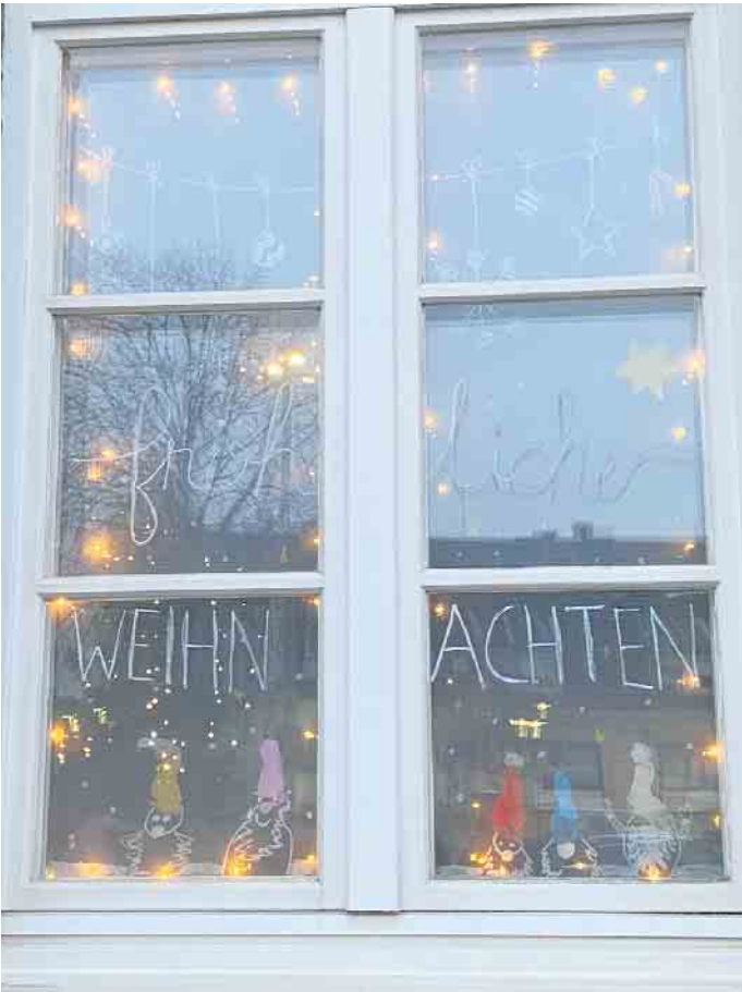
Fenster der Erziehungsberatungsstelle in Giesendorf 2024

In der nahen Adventszeit leuchten in Giesendorf wieder helle Weihnachtsfenster! Vom 1. bis zum 23. Dezember soll jeweils um 18 Uhr ein liebevoll gestaltetes Fenster feierlich enthüllt werden. Jeder aus dem Dorf ist herzlich eingeladen, sich an der Aktion zu beteiligen und auch ein Fenster zu dekorieren. Advent bedeutet „Zusammenkommen“, und genau das ist die Idee der Aktion: Nachbarn, Freunde und Dorfbewohner - egal ob Groß oder Klein - treffen